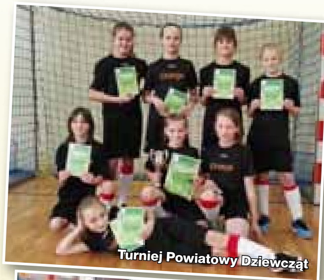
Turniej Powiatowy Dziewcząt