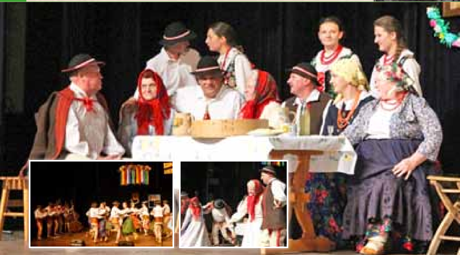
Zespół Regionalny GORCE z Kamienicy na Limanowskiej Słazie