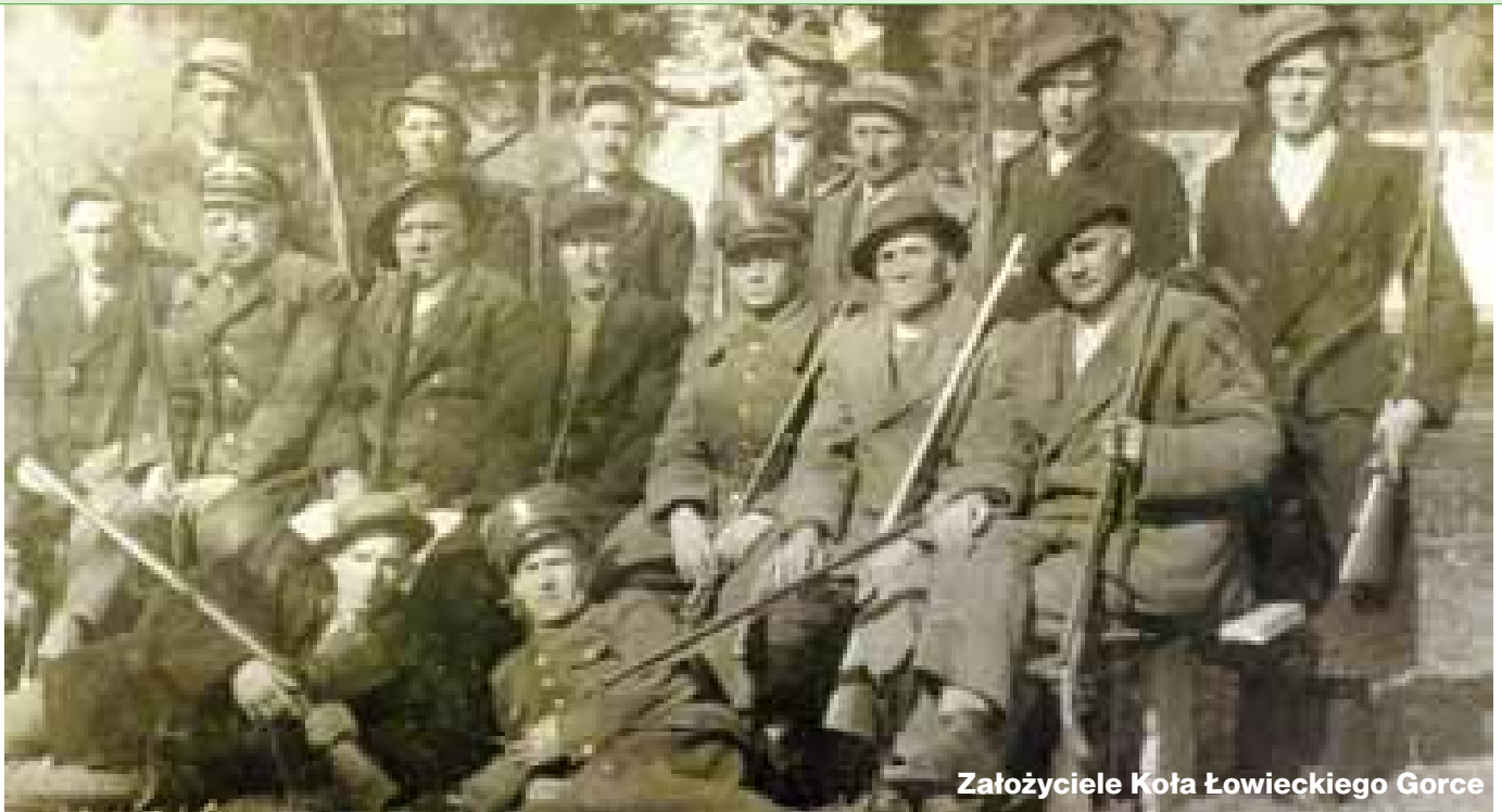
Założyciele Koła Łowieckiego Gorce