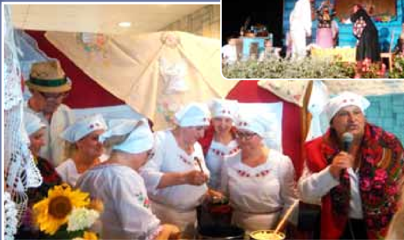
Koło Gospodyń Wiejskich z Zalesia na Małopolskim Przeglądzie Dorobku Artystycznego i Kulinarnego w Jabłonce.