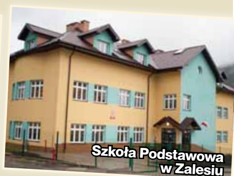
Szkoła Podstawowa w Zalesiu

mieszkańca. Wybudowaliśmy wówczas oczyszczalnię ścieków w Kamienicy oraz kilka etapów sieci kanalizacyjnej w Kamienicy, Zbludzy i w Zasadnem.