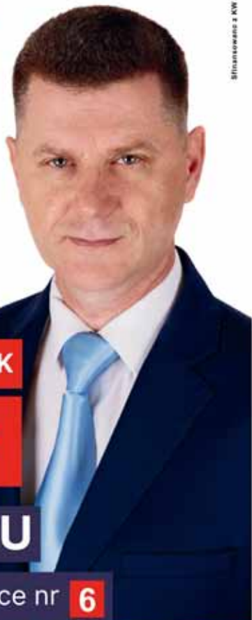
Bliźniaczka z KW bezpartyjni samorządowcy