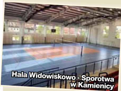
Hala Widowiskowo - Sportowa w Kamienicy