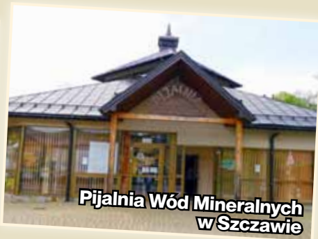
Pijalnia Wód Mineralnych w Szczawie