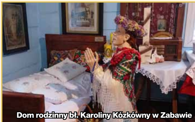
Dom rodzinny bł. Karoliny Kózkówny w Zabawie