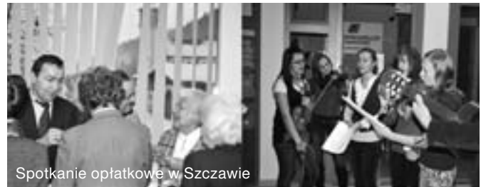
Spotkanie opłatkowe w Szczawie