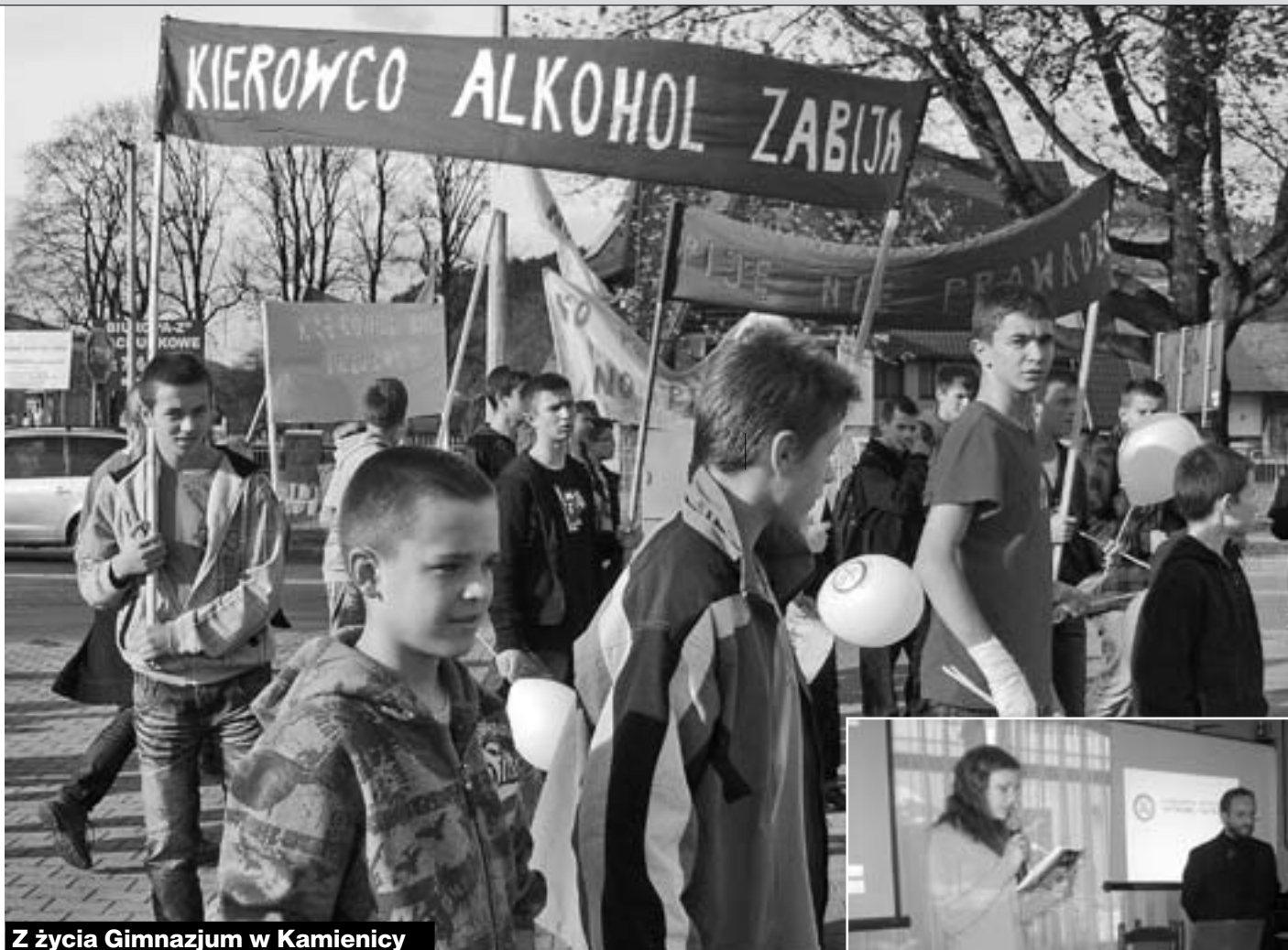
Z życia Gimnazjum w Kamienicy