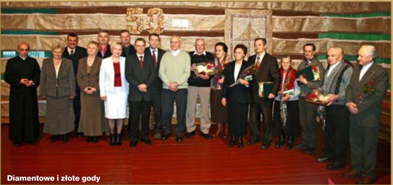
Diaamentowe i złote gody