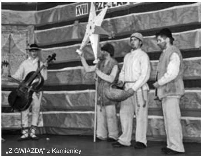
„Z GWIAZDĄ” z Kamienicy