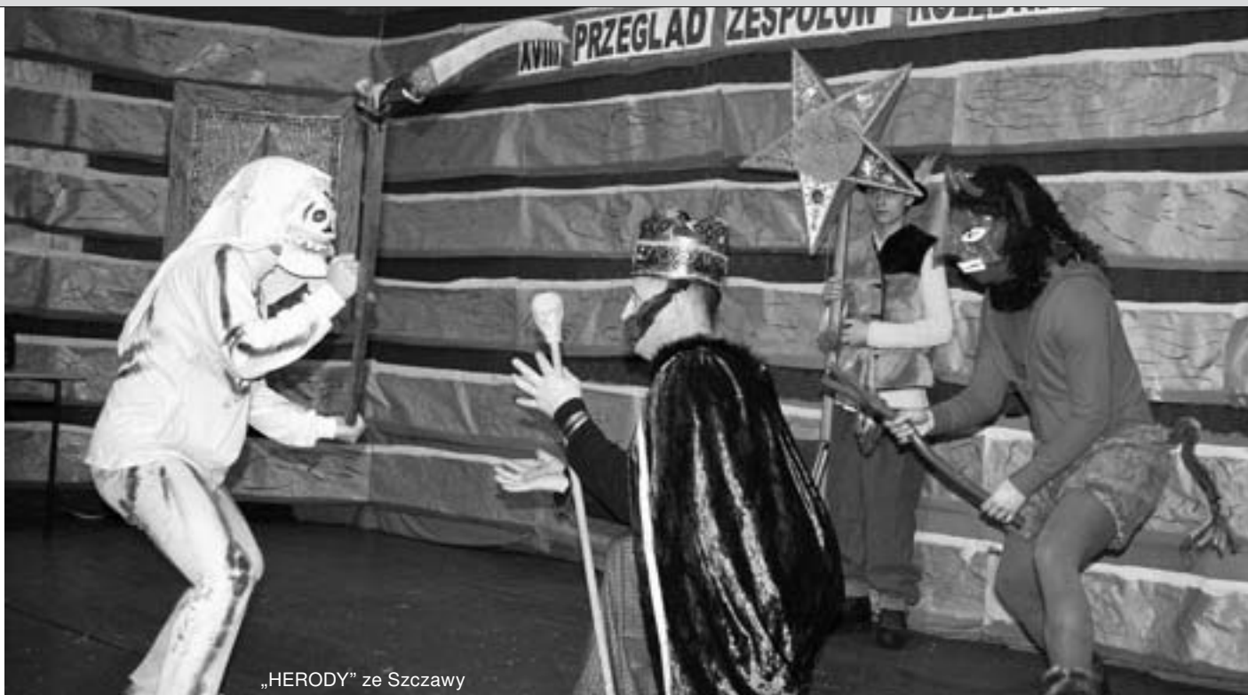
„HERODY” ze Szczawy