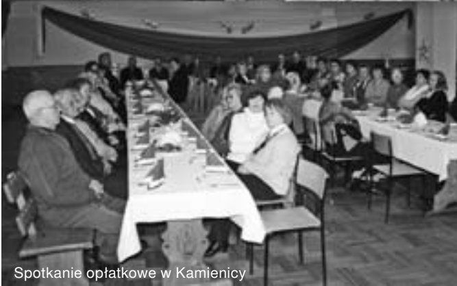
Spotkanie opłatkowe w Kamienicy