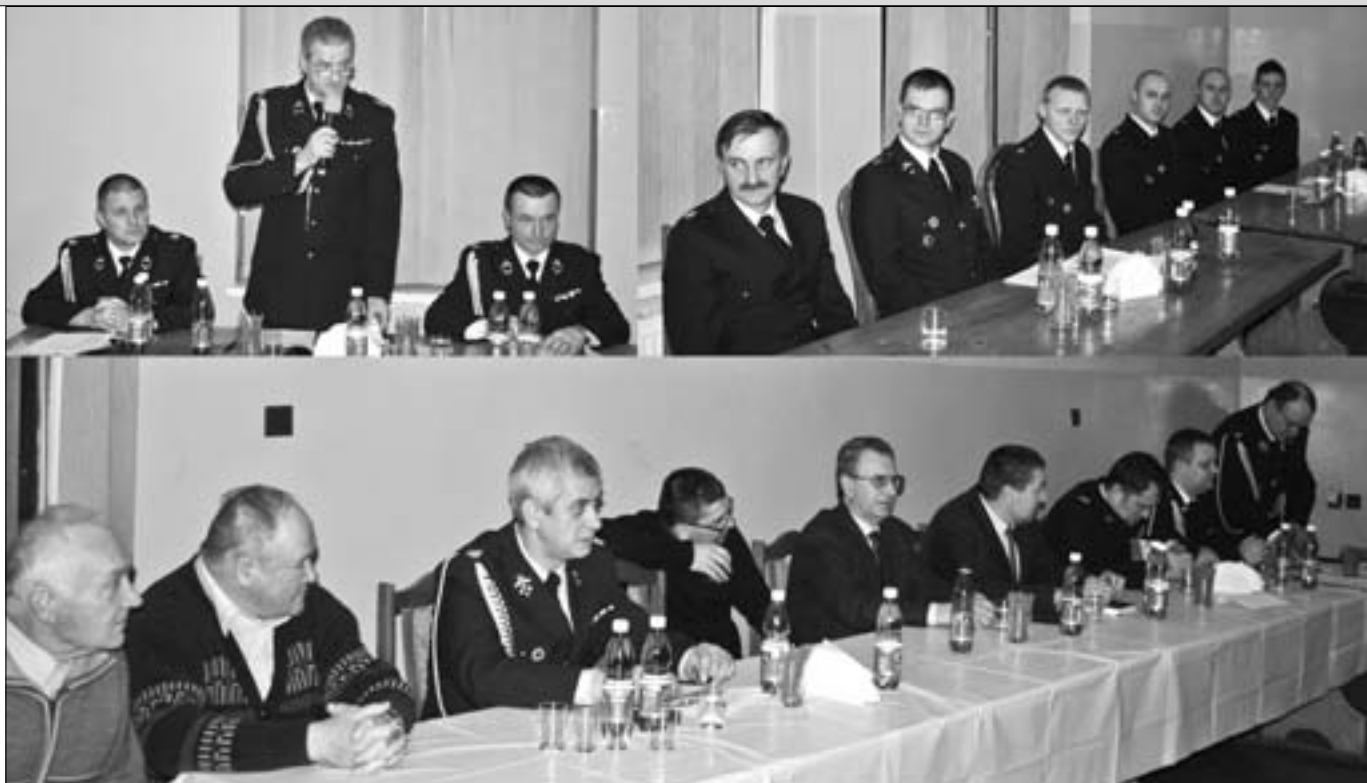
Zebrań OSP w Kamienicy