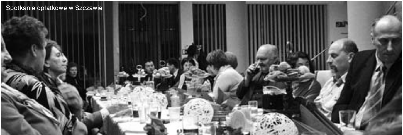
Spotkanie opłatkowe w Szczawie