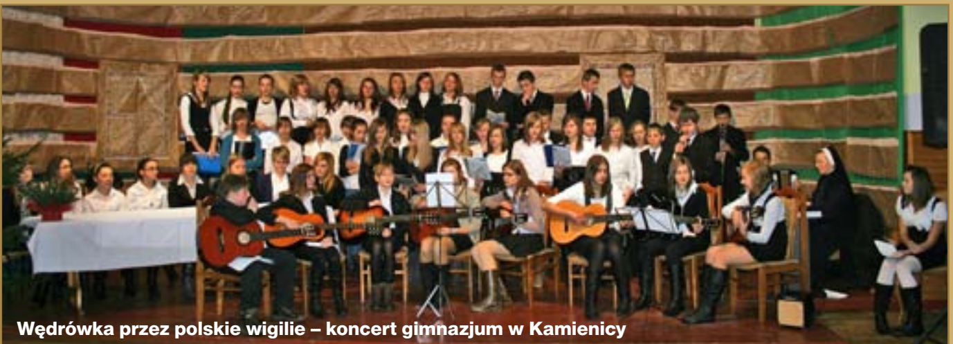
Wędrówka przez polskie wigilie – koncert gimnazjum w Kamienicy