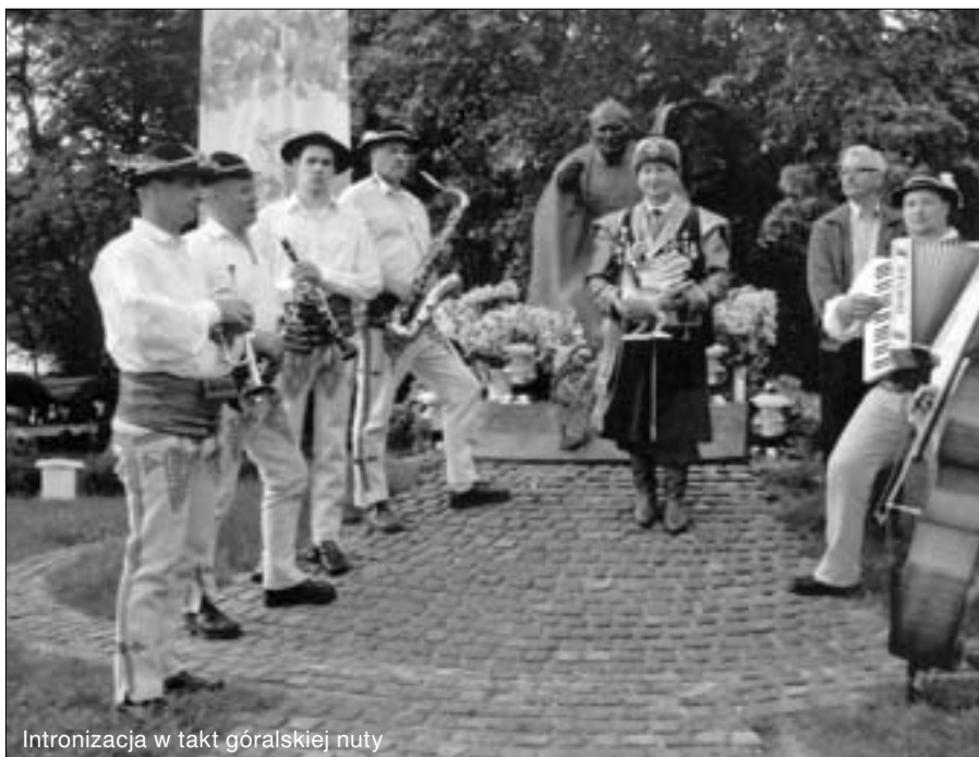
Intronizacja w takt góralskiej nuty