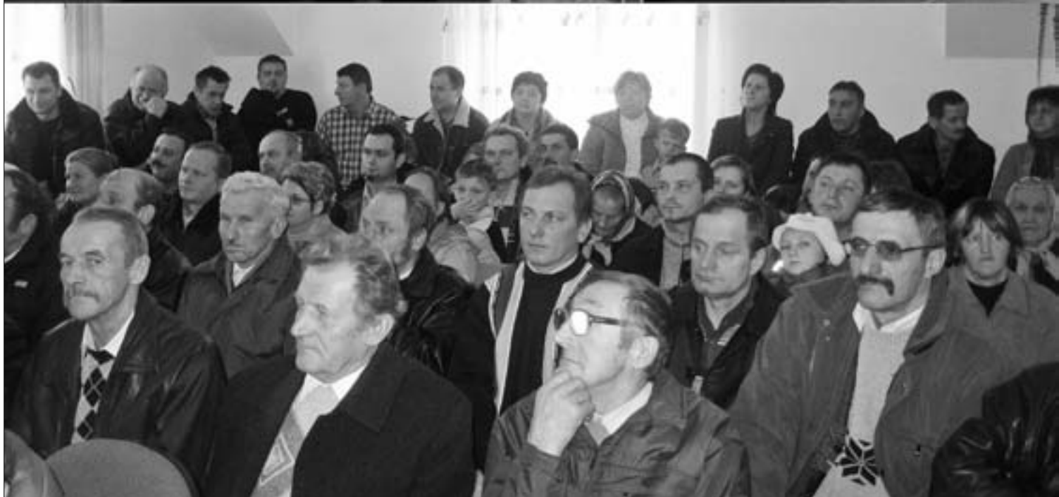
Zebranie w Zasadnem