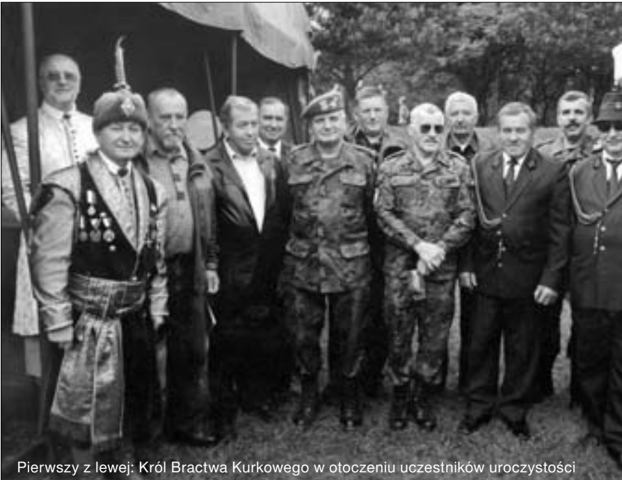
Pierwszy z lewej: Król Bractwa Kurkowego w otoczeniu uczestników uroczystości

Ufundowaliśmy kilkadziesiąt pomników najwybitniejszego z Polaków, papieża Jana Pawła II, od Europy przez Amerykę do Australii. Jesteśmy też fundatorem Kościoła Sanktuarium Bożego Miłosierdzia „Nie lękajcie się” w Łagiewnikach.