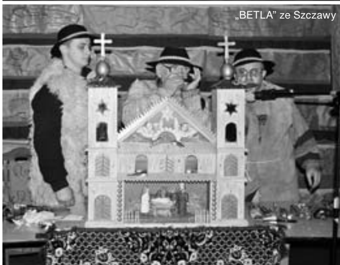
„BETLA” ze Szczawy