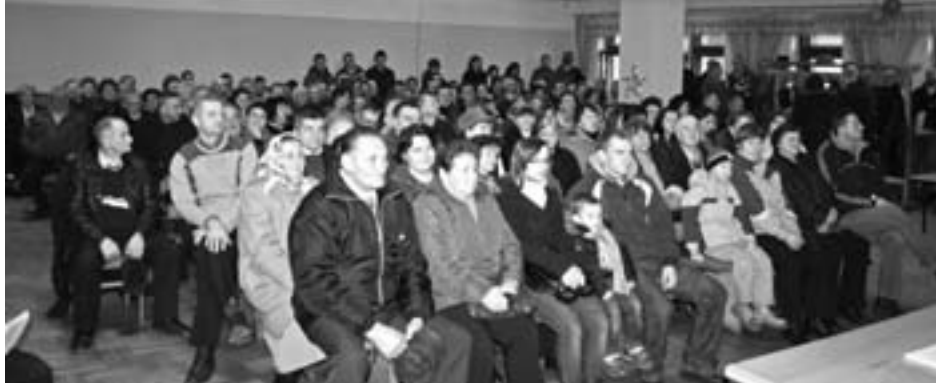
Zebranie w Kamienicy