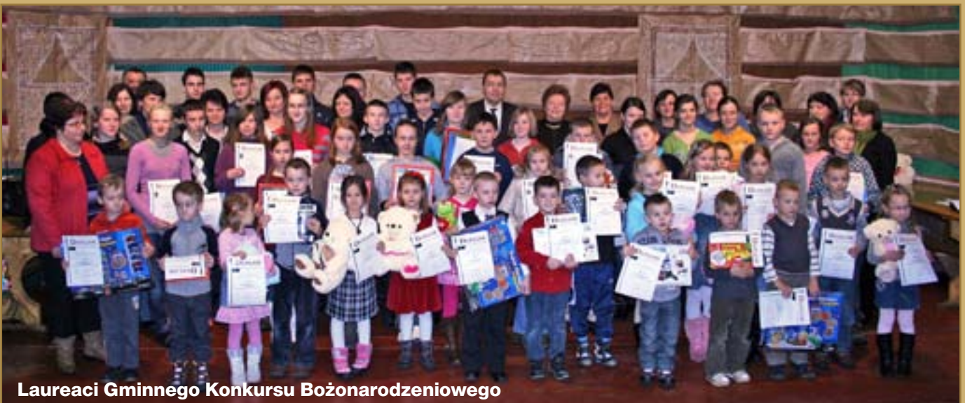
Laureaci Gminnego Konkursu Bożonarodzeniowego