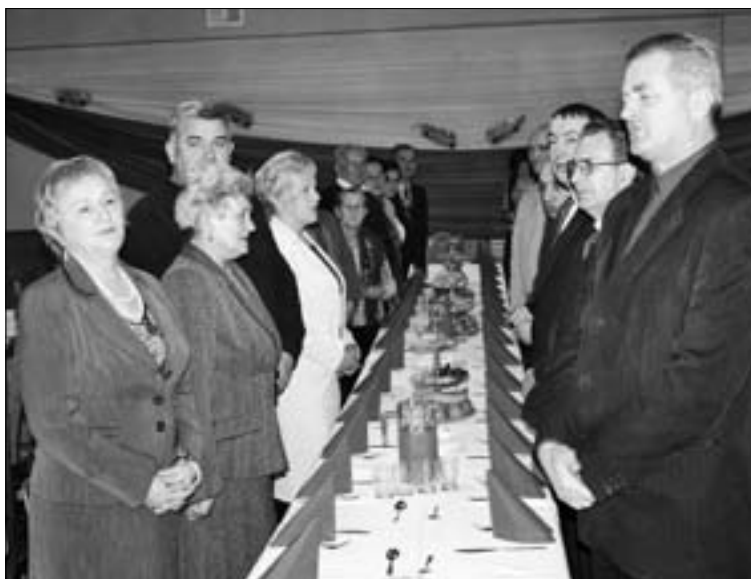
Tradycyjne „100 lat”

28 grudnia 2010 r. w Gminnym Ośrodku Kultury w Kamienicy odbyła się uroczystość wręczenia 14 parom małżeńskim z naszej gminy okolicznościowych medali „Za Długoletnie Pożycie Małżeńskie” – przyznanych przez Prezydenta RP.