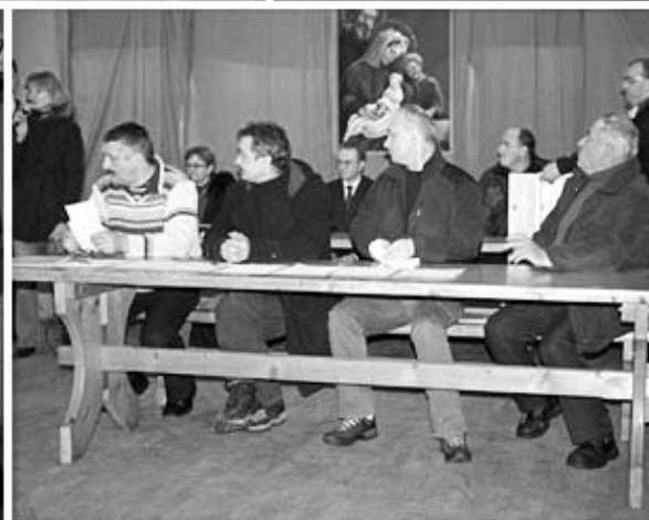
Zebranie w Szczawie