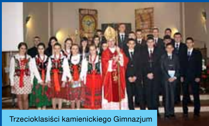
Trzecioklasiści kamienickiego Gimnazjum