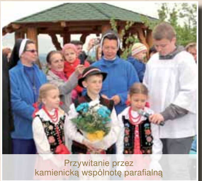
Przywitanie przez kamienicką wspólnotę parafialną