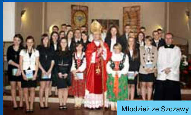
Młodzież ze Szczawy