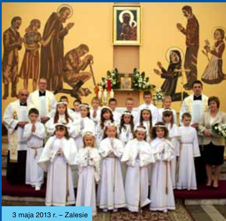
3 maja 2013 r. – Zalesie