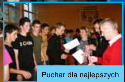
Puchar dla najlepszych