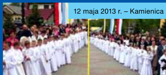
12 maja 2013 r. – Kamienica