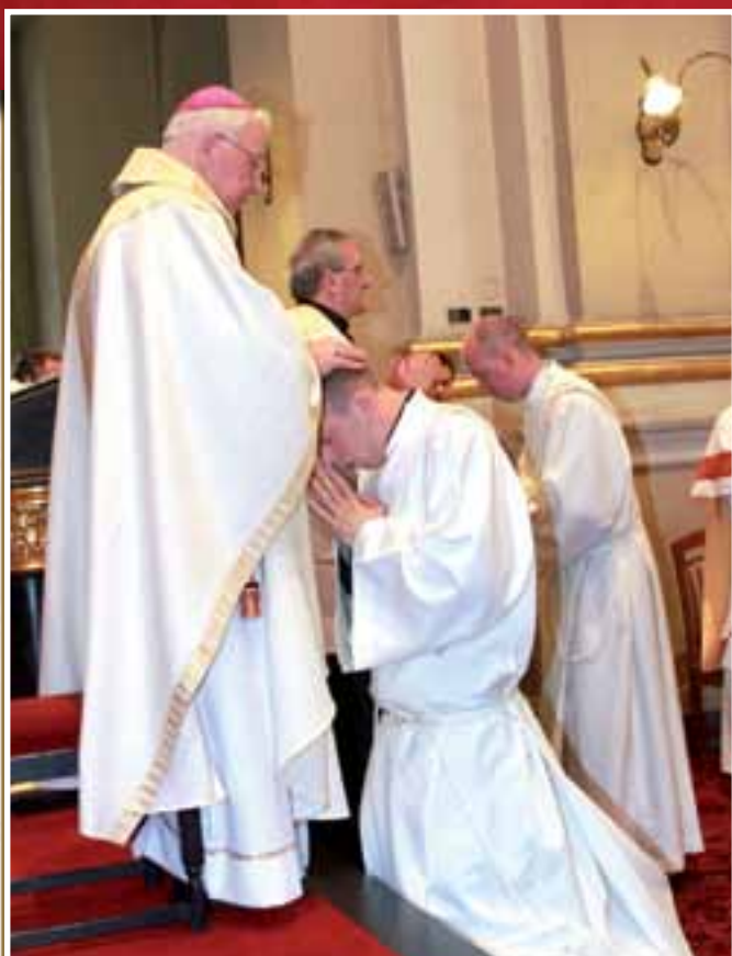
Święcenia kapłańskie w seminaryjnym kościele Księży Misjonarzy p.w. Nawrócenia św. Pawła Apostoła w Krakowie