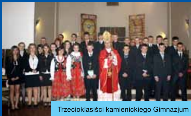
Trzecioklasiści kamienickiego Gimnazjum