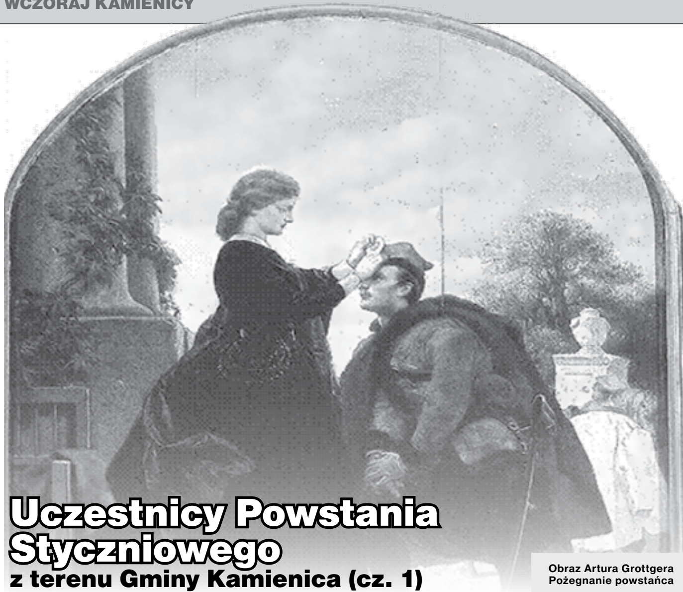
Obraz Artura Grottgera Pożegnanie powstańca