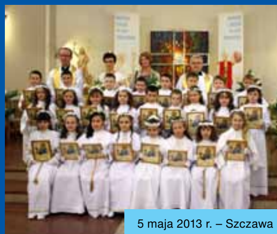
5 maja 2013 r. – Szczawa