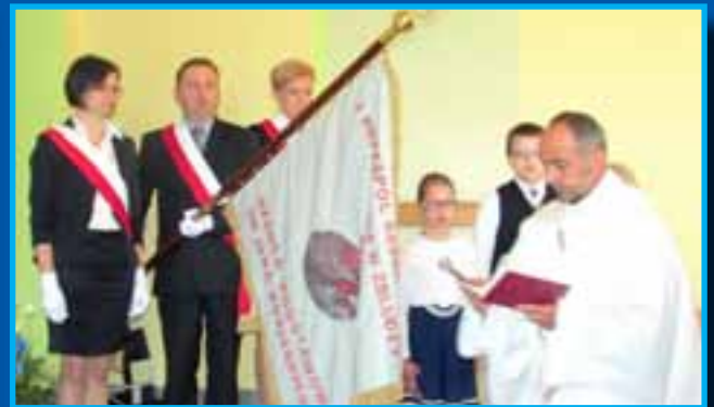
Wielopokoleniowe grono nauczycielskie