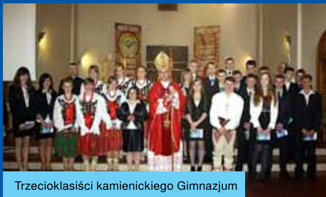
Trzecioklasiści kamienickiego Gimnazjum