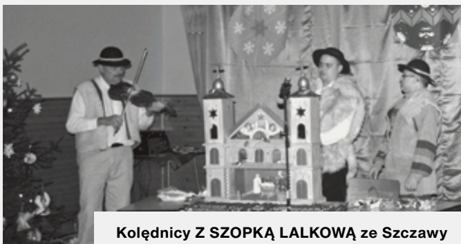
Kolędnicy Z SZOPKĄ LALKOWĄ ze Szczawy