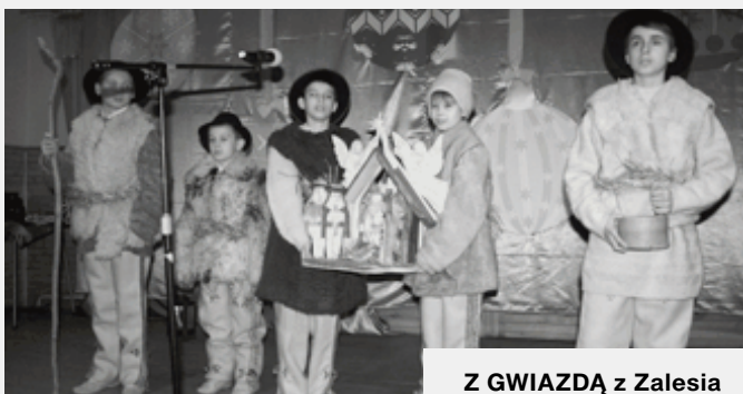
Z GWIAZDĄ z Zalesia