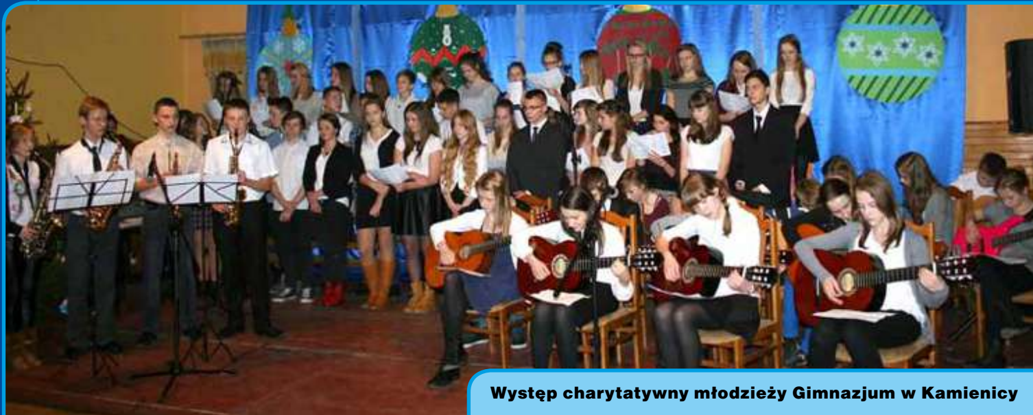
Występ charytatywny młodzieży Gimnazjum w Kamienicy