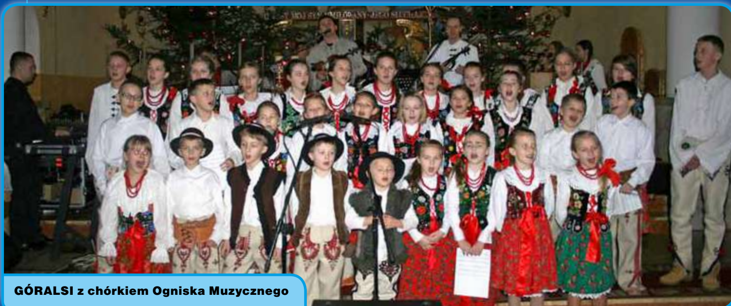
GÓRALSI z chórkami Ogniska Muzycznego