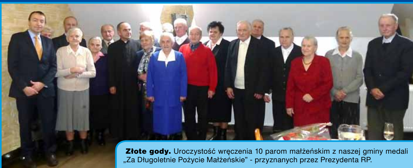
Złote gody. Uroczystość wręczenia 10 parom małżeńskim z naszej gminy medali „Za Długoletnie Pożycie Małżeńskie” - przyznanych przez Prezydenta RP.