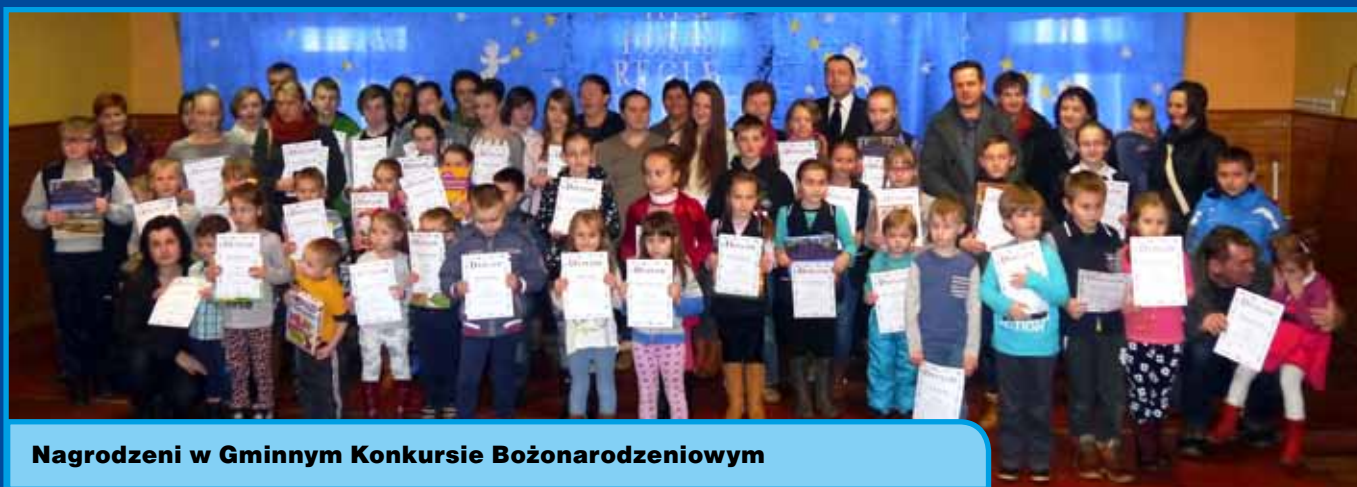
Nagrodzeni w Gminnym Konkursie Bożonarodzeniowym