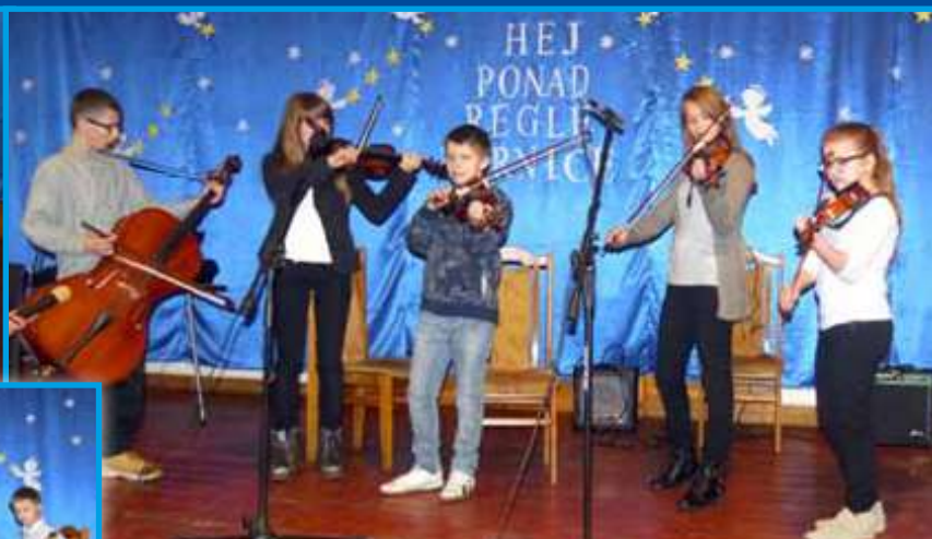
Prezentacja umiejętności uczniów Ogniska Muzycznego