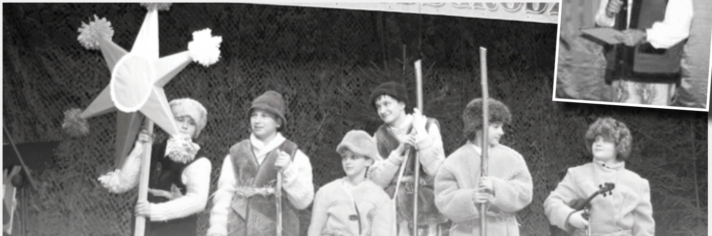
Z GWIAZDĄ z Zasadnego