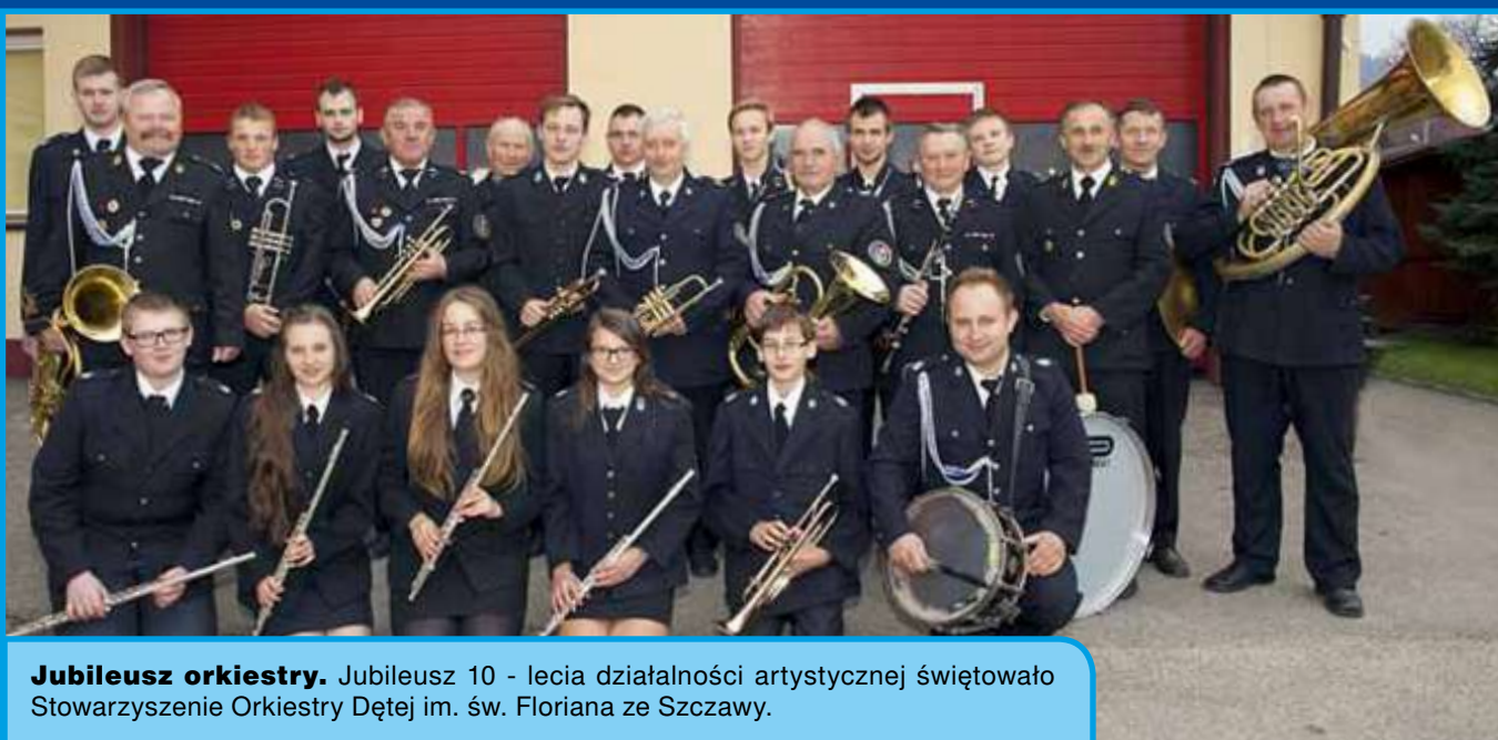
Jubileusz orkiestry. Jubileusz 10 - lecia działalności artystycznej świętowało Stowarzyszenie Orkiestry Dętej im. św. Floriana ze Szczawy.