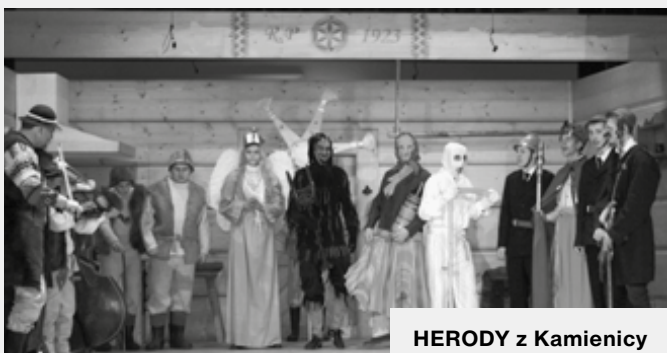
HERODY z Kamienicy