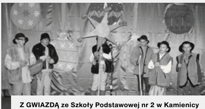
Z GWIAZDĄ ze Szkoły Podstawowej nr 2 w Kamienicy