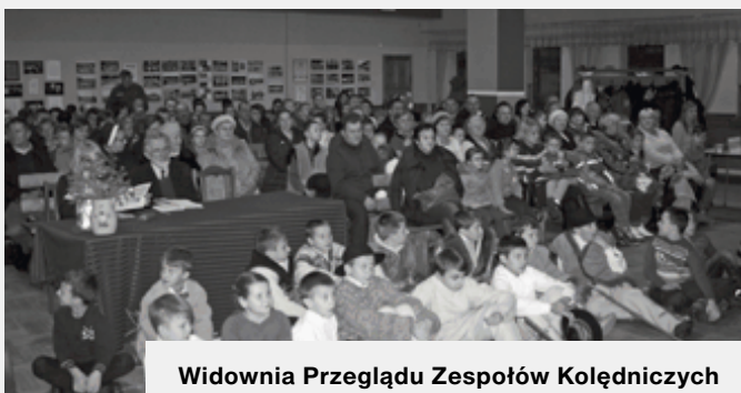
Widownia Przeglądu Zespołów Kolędniczych