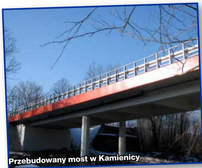
Przebudowany most w Kamienicy