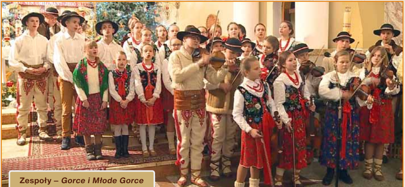
Zespoły – Gorce i Młode Gorce