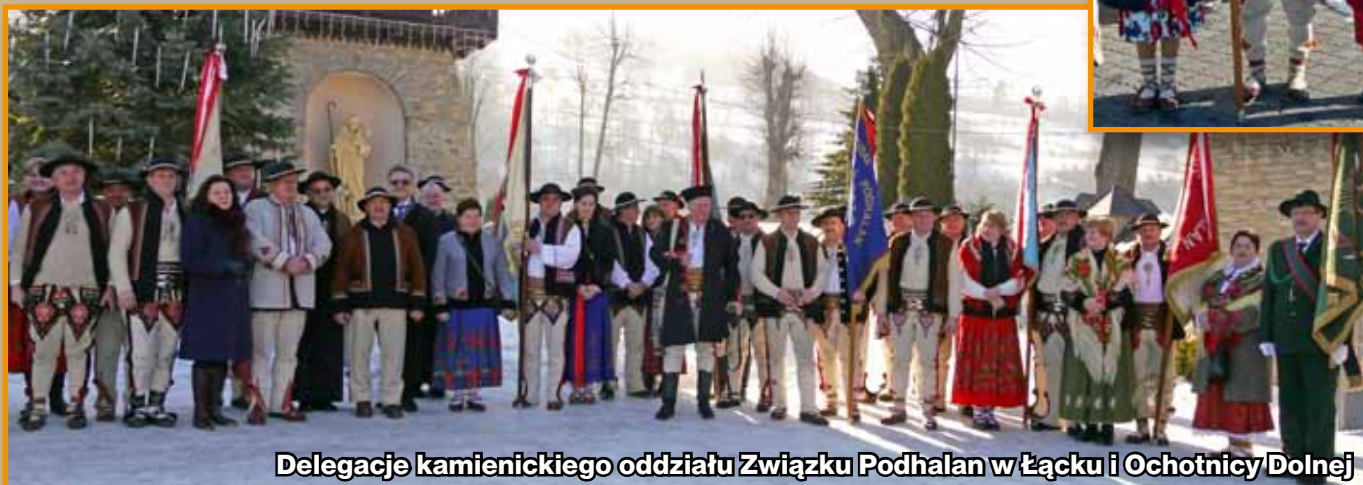
Delegacje kamienickiego oddziału Związku Podhalan w Łączku i Ochotnicy Dolnej