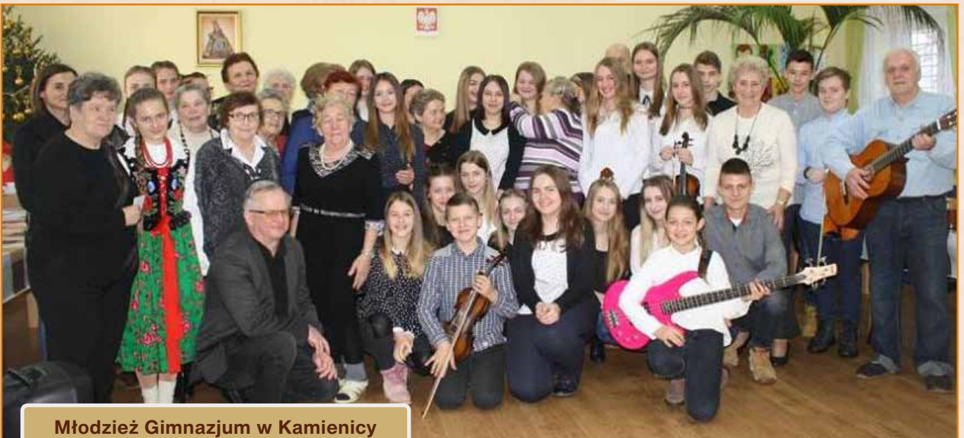
Młodzież Gimnazjum w Kamienicy