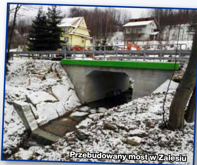
Przebudowany most w Zalesiu

Ostatnie miesiące były owocne w prace związane z poprawą infrastruktury drogowej na terenie Gminy Kamienica. Powiat Limanowski na terenie gminy zrealizował szereg inwestycji, które znacząco wpłynęły na bezpieczeństwo i lepszą jakość poruszania się powiatowymi drogami.