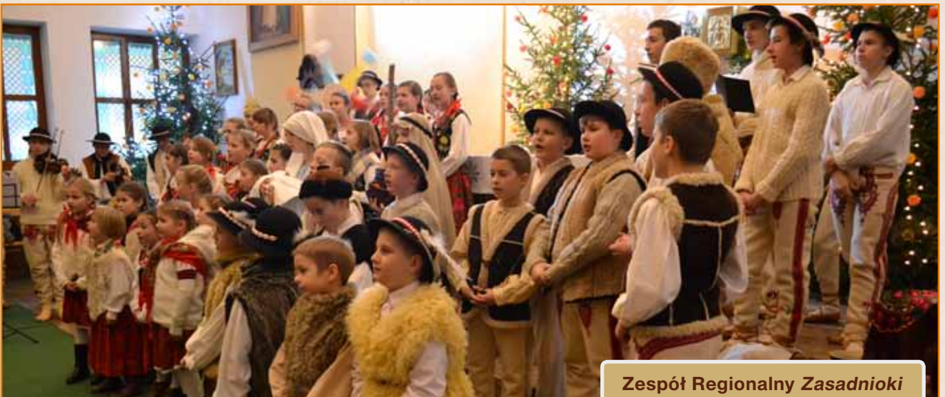
Zespół Regionalny Zasadnioki