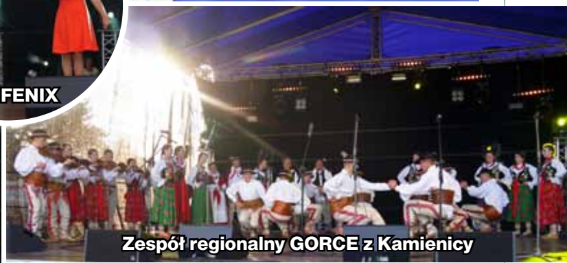
Zespół regionalny GORCE z Kamienicy