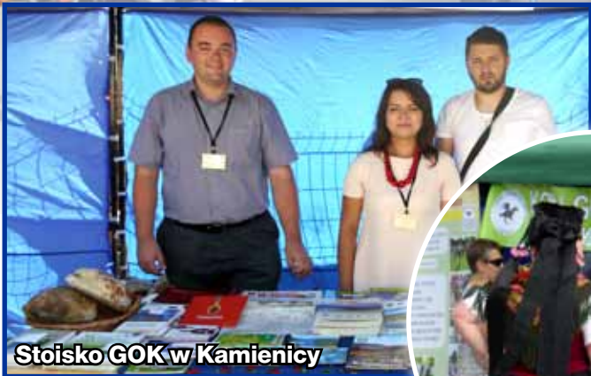
Stoisko GOK w Kamienicy