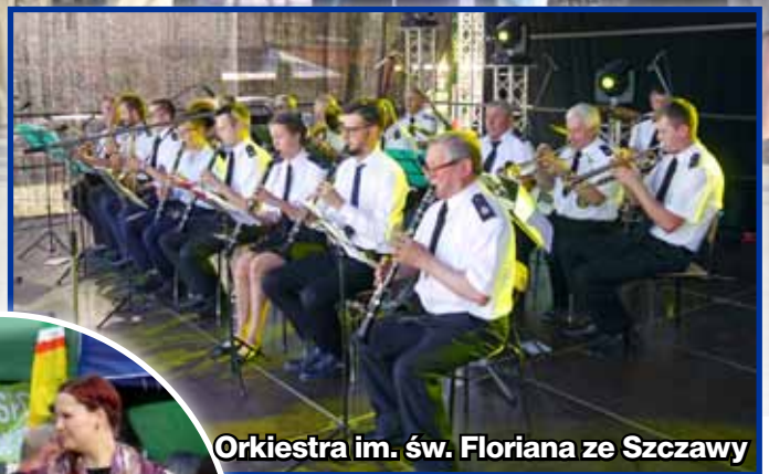
Orkiestra im. św. Floriana ze Szczawy