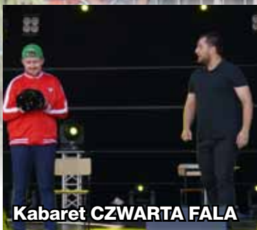
Kabaret CZWARTA FALA