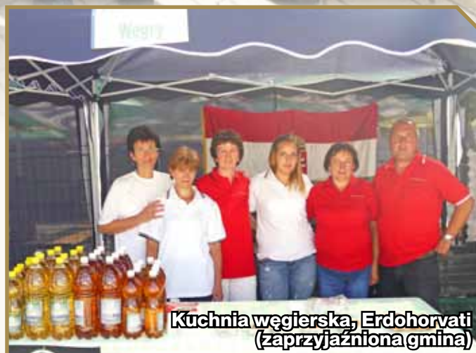
Kuchnia węgierska, Erdohorvati (zaprzyjaźniona gmina)