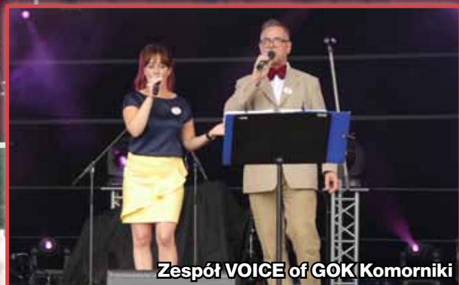
Zespół VOICE of GOK Komorniki