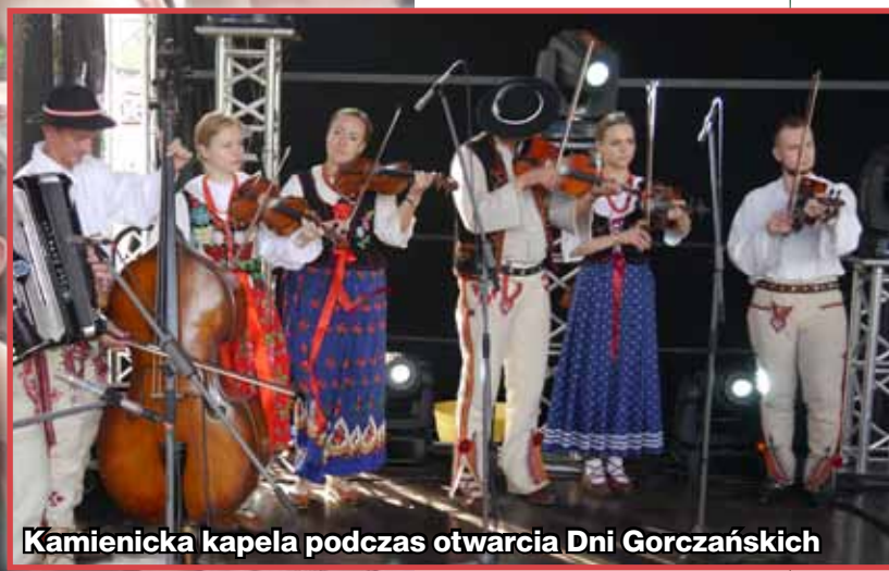
Kamienicka kapela podczas otwarcia Dni Gorczańskich