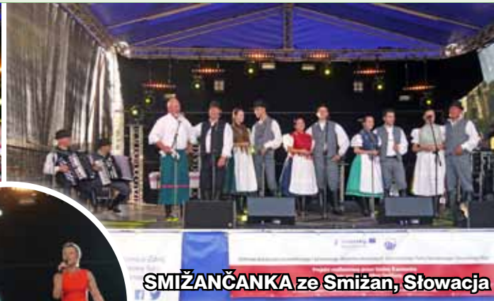
SMIŽANČANKA ze Smižan, Słowacja