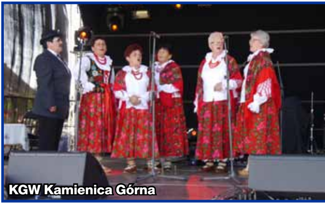
KGW Kamienica Górna