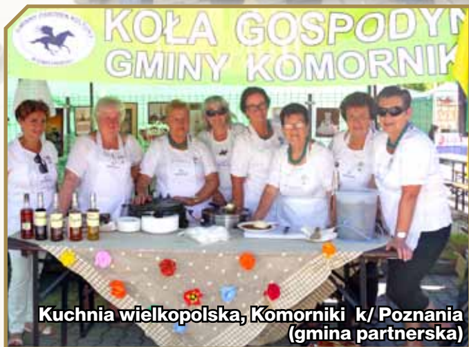
Kuchnia wielkopolska, Komorniki k/ Poznania (gmina partnerska)