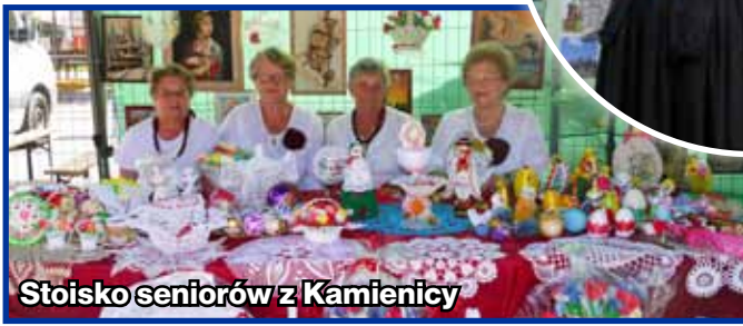
Stoisko seniorów z Kamienicy