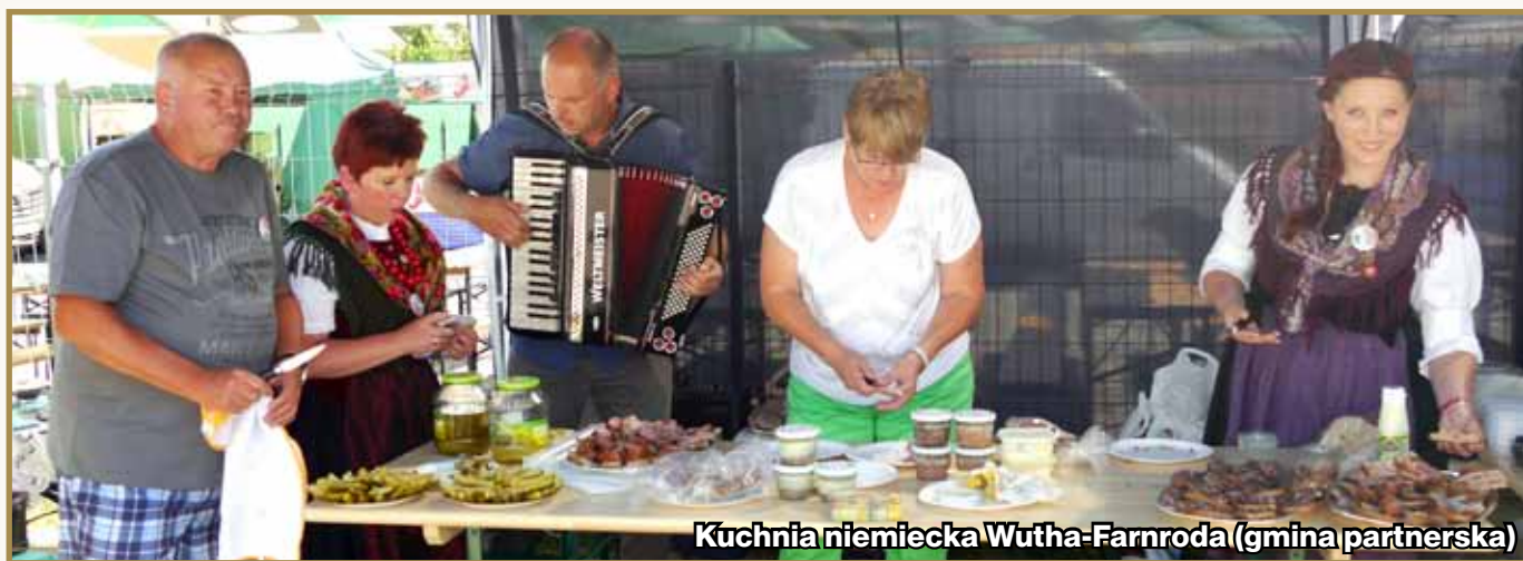
Kuchnia niemiecka Wutha-Farnroda (gmina partnerska)