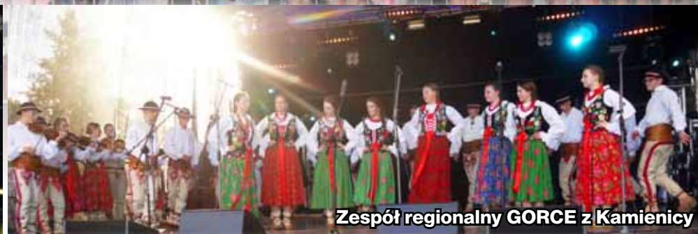
Zespół regionalny GORCE z Kamienicy