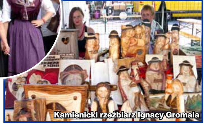
Kamienicki rzeźbiarz Ignacy Gromala