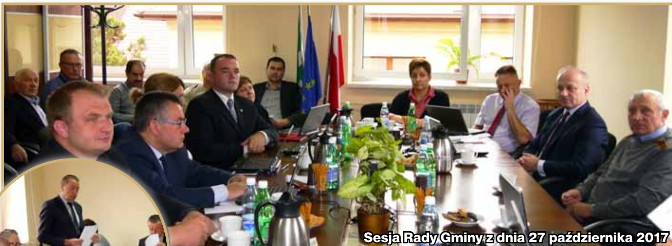
Sesja Rady Gminy z dnia 27 października 2017

uzdrowiskowego i urzędzenia lecznictwa uzdrowiskowego, przygotowane do prowadzenia lecznictwa uzdrowiskowego; spełnia określone w przepisach o ochronie środowiska wymagania