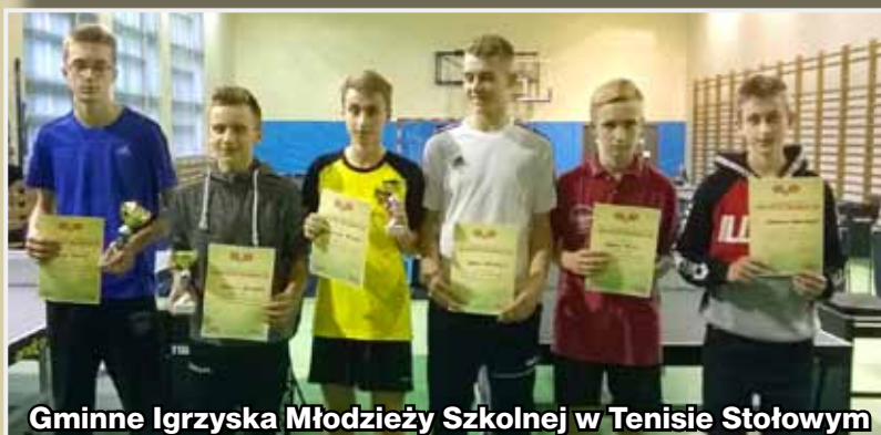
Gminne Igrzyska Młodzieży Szkolnej w Tenisie Stołowym