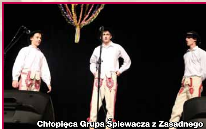
Chłopciska Grupa Śpiewacza z Zasadnego

W protokole konkursowym komisja podkreśliła duże znaczenie festiwalu folklorystycznego „Limanowska Słaza” dla aktywizacji ruchu regionalnego Ziemi Limanowskiej, przyznając, że: Wieloletni warsztatowy charakter festiwalu w widoczny sposób przyczynił się do stale wzrastającego merytoryczno-artystycznego poziomu występujących grup i wszystkich wykonawców. S.F.