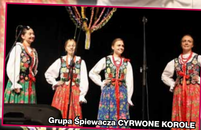
Grupa Śpiewacza CYRWONE KOROLE