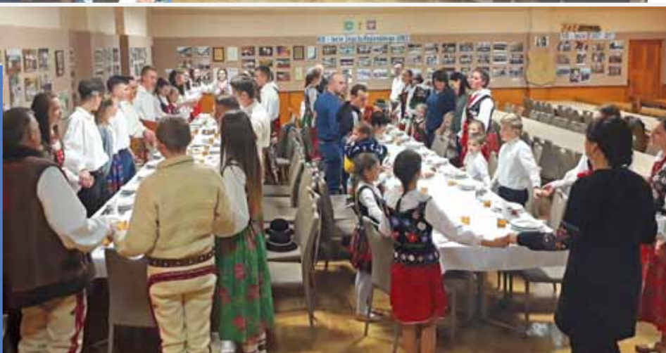
Zespoły: Młode Gorce oraz GORCE