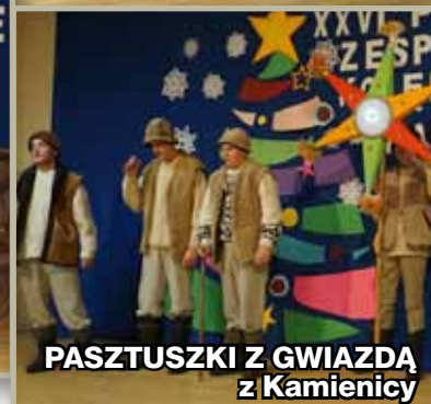
PASZTUSZKI Z GWIAZDĄ z Kamienicy