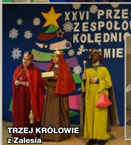
TRZEJ KRÓLOWIE z Zalesia