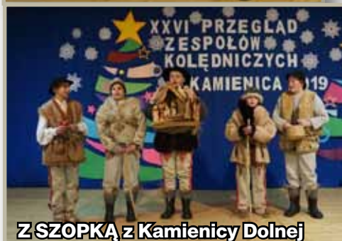
Z SZOPKĄ z Kamienicy Dolnej