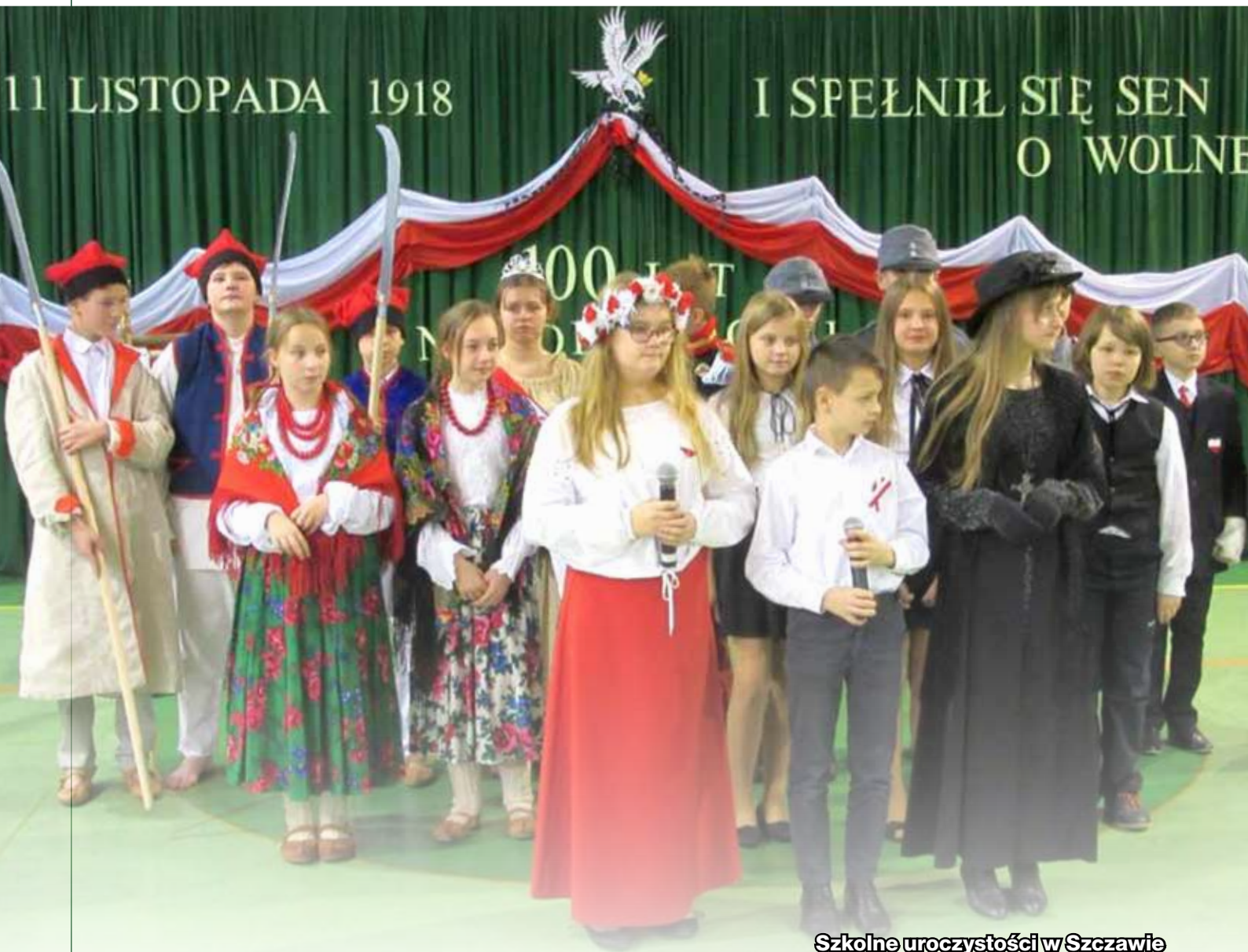
Szkolne uroczystości w Szczawie