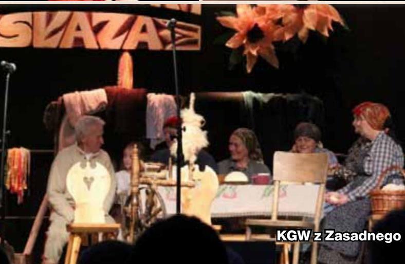
KGW z Zasadnego