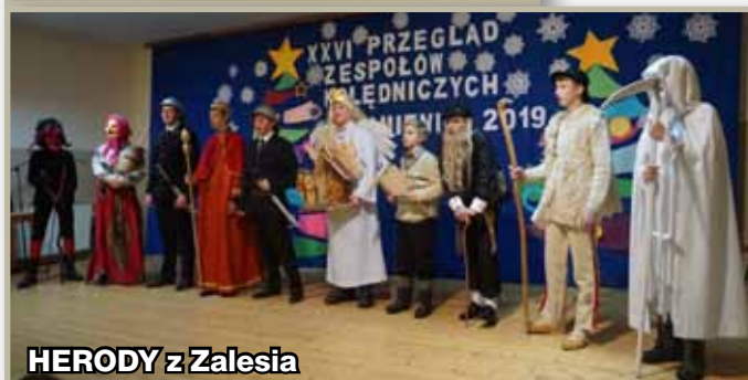
HERODY z Zalesia