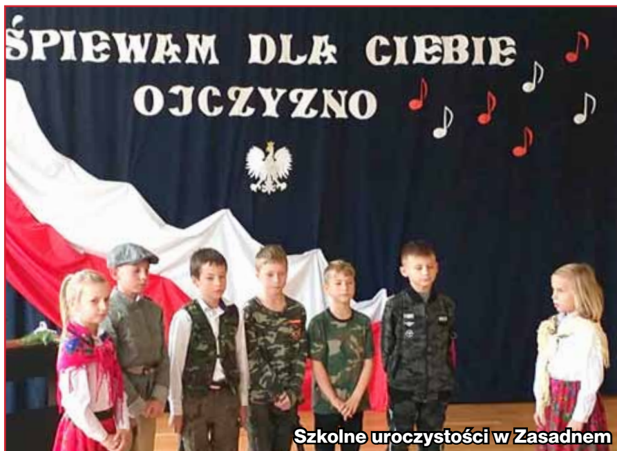
Szkolne uroczystości w Zasadnem

Codziennie na przerwie po drugiej lekcji uczniowie czytali fragmenty poezji i prozy polskiej opisujące zrywy niepodległościowe Polaków, ich marzenia o wolnej Polsce, a także ukazujące ogromną tęsknotę tych, których los rzucił z dala od stron ojczyźnych. Również codziennie na długiej przerwie, przy akompaniamencie szkolnego zespołu muzycznego, śpiewano pieśni patriotyczne. Ponadto cała społeczność uczniowska włączyła się w ogólnopolską akcję „Rekord dla Niepodległej”, w ramach której odśpiewany