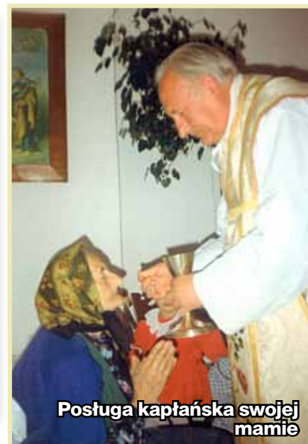
Postługa kapłańska swojej mamie

Tu, z tego miejsca, dziękuję bardzo serdecznie wszystkim parafianom,