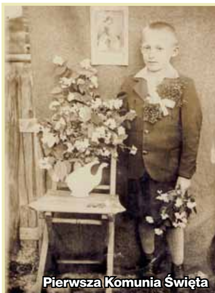
Pierwsza Komunia Święta

Po Ochotnicy ks. biskup powołał mnie na proboszcza w Siekierczynie koło Limanowej, skąd pochodzili rodzice ks. kardynała Króla z Filadelfii. Przede mną dwóch moich kolegów odmówiło biskupowi przyjęcia Siekierczyny, bo warunki też były tam bardzo ciężkie. Nie było drogi, autobusu, przez 4 miesiące kościół zasypany śniegiem, nie było plebanii, bo parafia dopiero co się tworzyła. Mieszkałem w wynajętej chatce