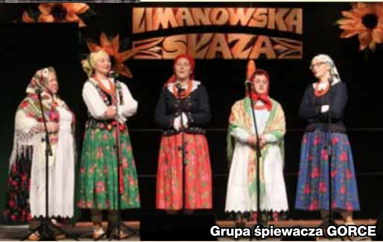
Grupa śpiewacza GORCE