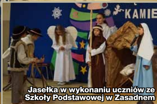
Jasełka w wykonaniu uczniów ze Szkoły Podstawowej w Zasadnem