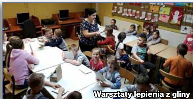
Warsztaty lepienia z gliny