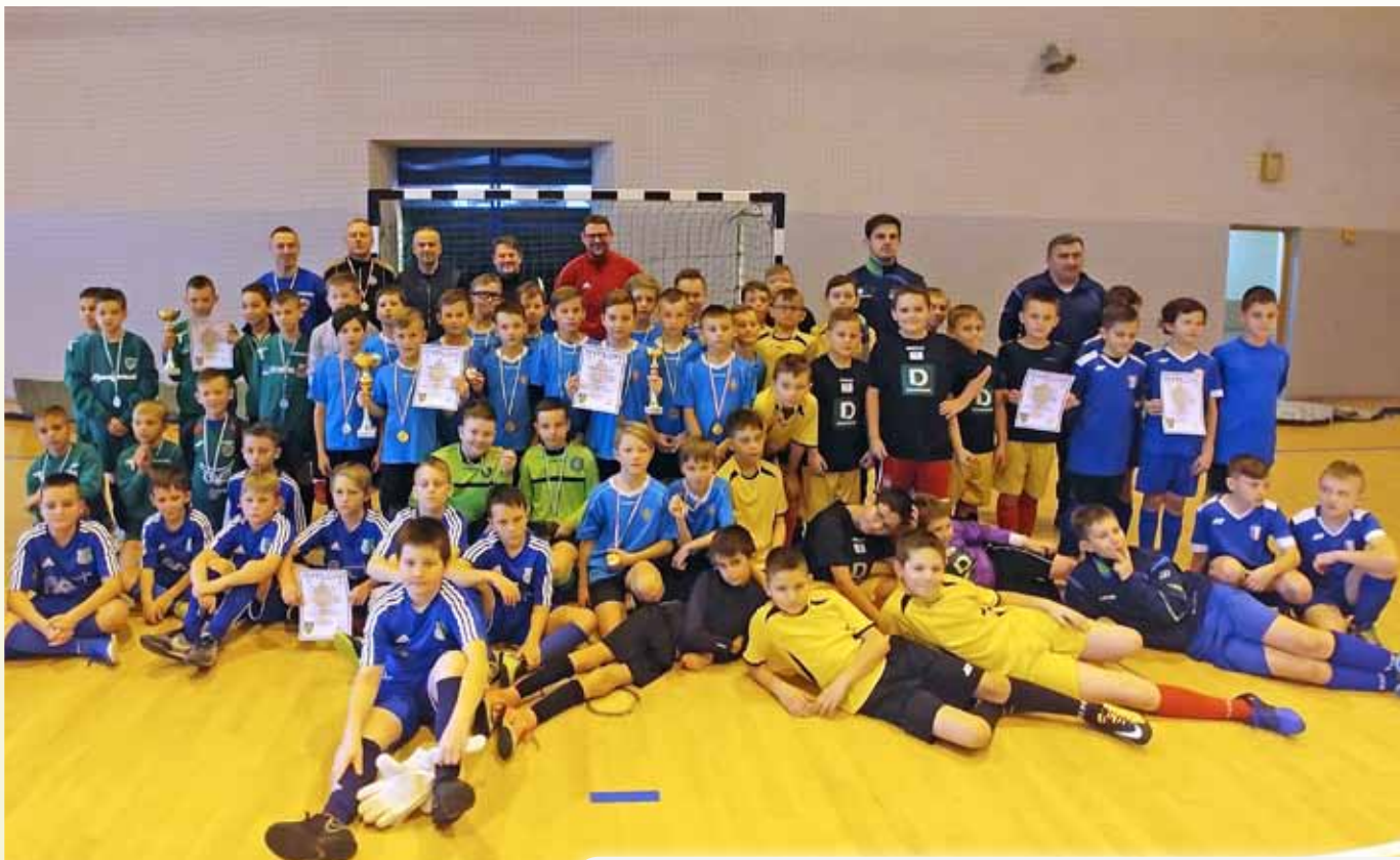
Turniej Piłki Nożnej o Puchar Prezesa UKS „LACH” Podegrodzie

Kolejne sukcesy zanotowały drużyny MUKS Halny Kamienica, wygrywając turnieje na przelocie minionego i nowego roku.