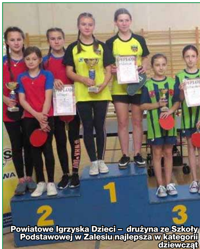
Powiatowe Igrzyska Dzieci – drużyna ze Szkoły Podstawowej w Zalesiu najlepsza w kategorii dziewcząt

8 stycznia 2019 r. w hali sportowej przy ZSTiO Limanowa odbyły się Powiatowe Igrzyska Młodzieży Szkolnej w piłce siatkowej dziewcząt ur. 2003-2005. Wicemistrzostwo powiatu zdobyły dziewczęta ze Szkoły Podstawowej nr 1 w Kamienicy. (red)