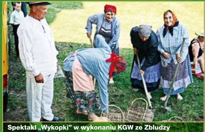
Spektakl „Wykopki” w wykonaniu KGW ze Zbludzy