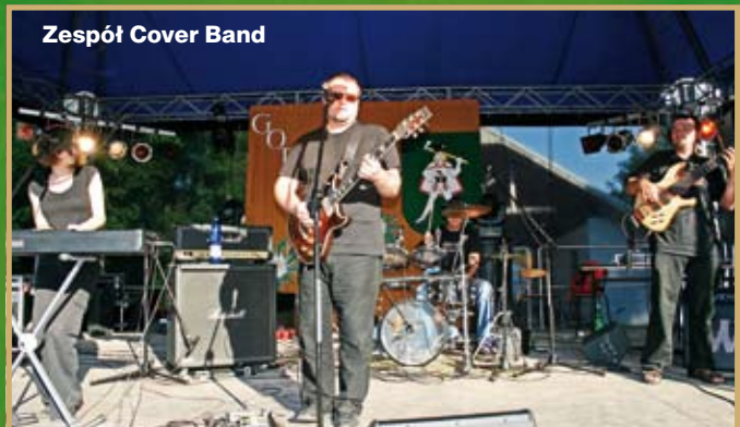
Zespół Cover Band