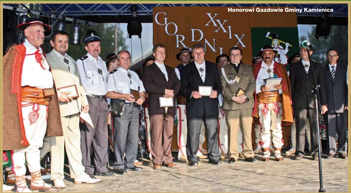
Honorowi Gazdowie Gminy Kamienica