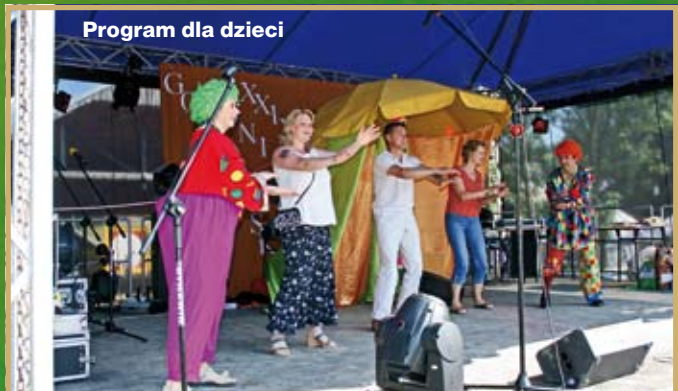
Program dla dzieci