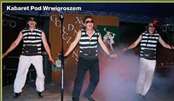
Kabaret Pod Wrwigoszem