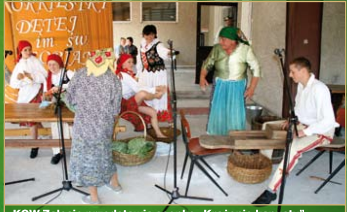
KGW Zalesie przedstawia scenkę „Krążenie kapusty”