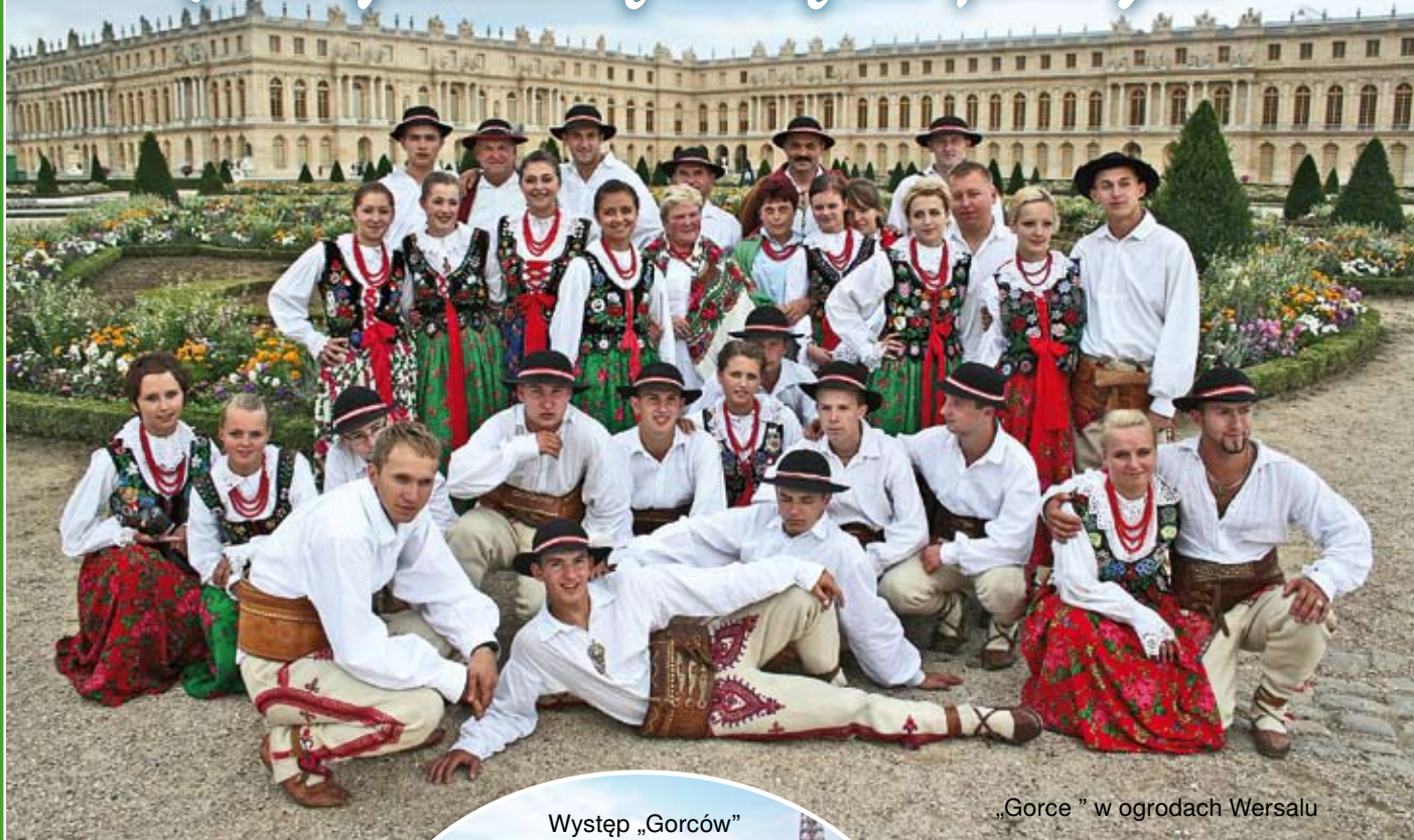
„Gorce” w ogrodach Wersalu