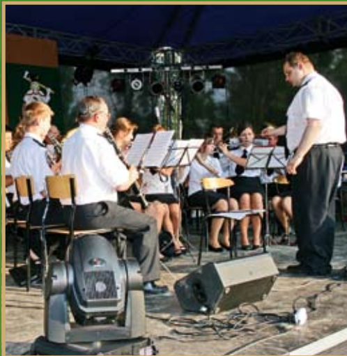
Jubileuszowy koncert orkiestry Dętej im. św. Floriana ze Szczawy