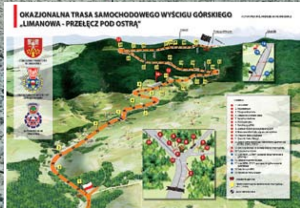
Samochodowe Mistrzostwa Polski w 2010 r.