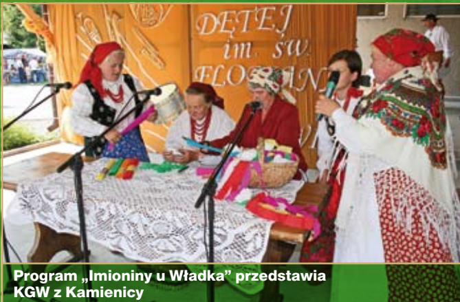
Program „Imioniny u Władka” przedstawia KGW z Kamienicy