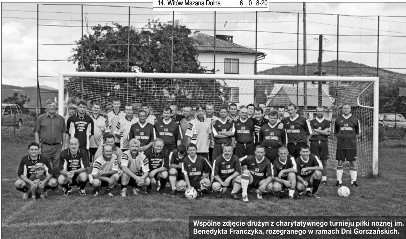
Wspólne zdjęcie drużyn z charytatywnego turnieju piłki nożnej im. Benedykta Franczyka, rozegranego w ramach Dni Gorczańskich.