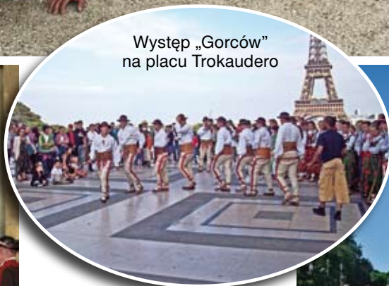
Występ „Gorców” na placu Trokaudero