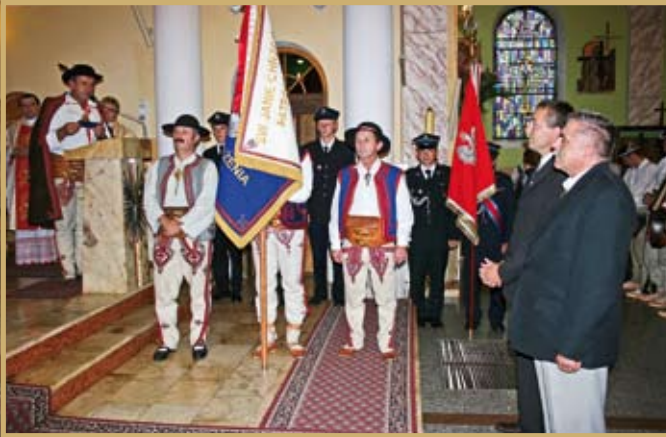
Uroczysta Msza Święta