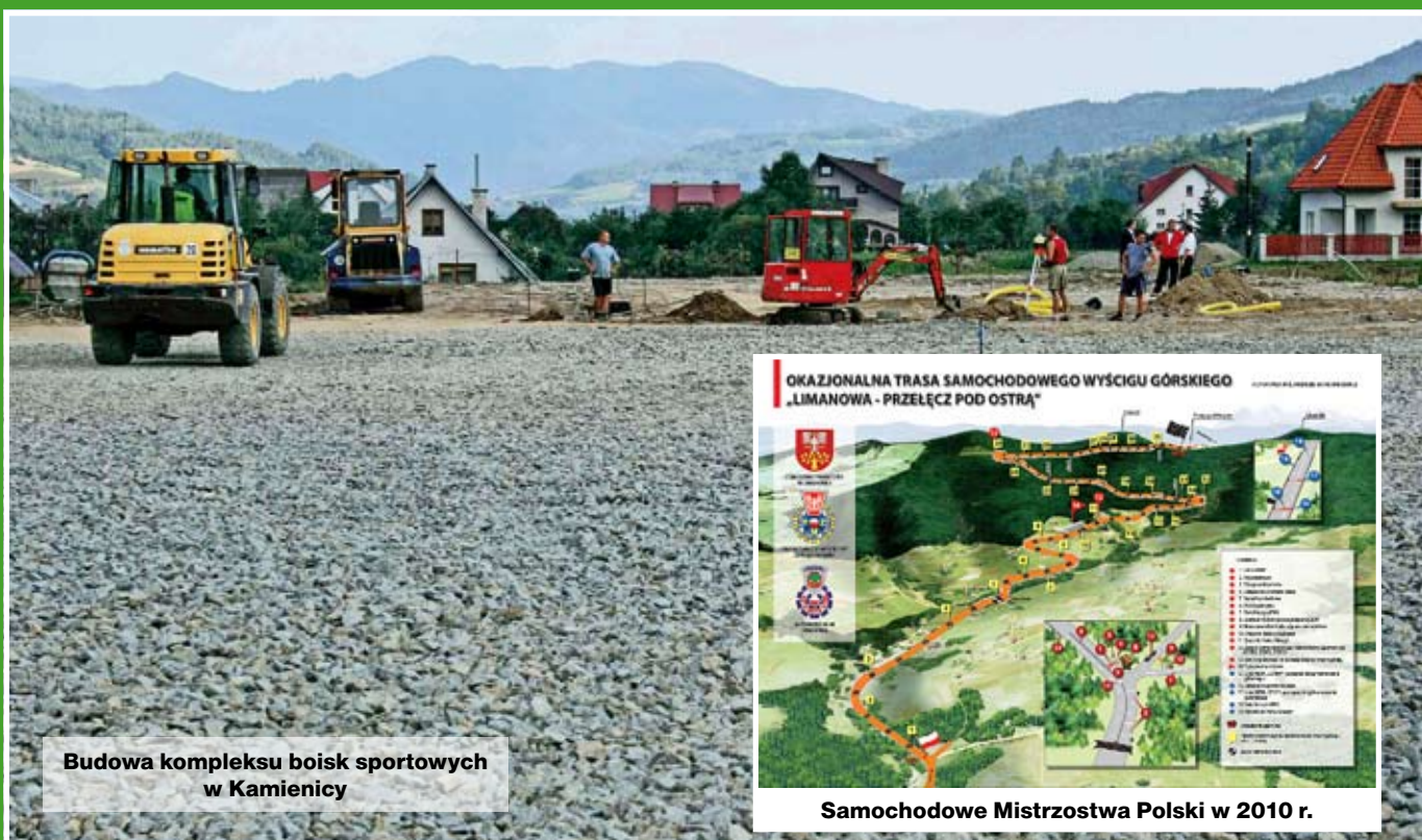
Budowa kompleksu boisk sportowych w Kamienicy