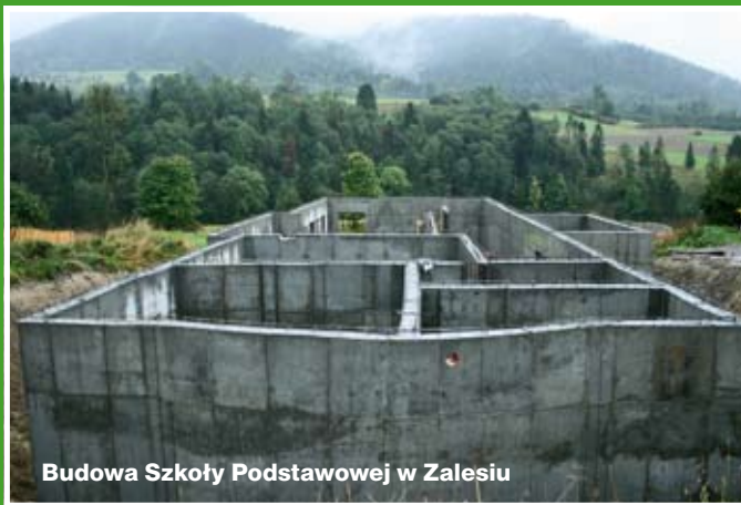
Budowa Szkoły Podstawowej w Zalesiu