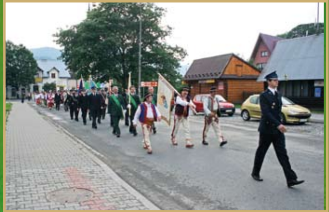
Przemarsz korowodu do amiteatru „Saturn”