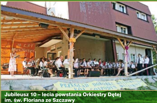
Jubileusz 10 – lecia powstania Orkiestry Dętej im. św. Floriana ze Szczawy