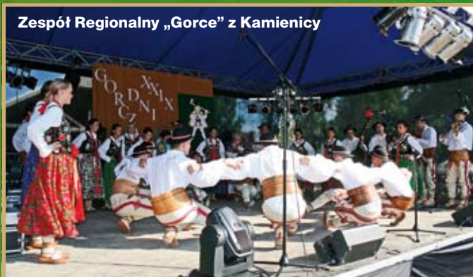
Zespół Regionalny „Gorce” z Kamienicy