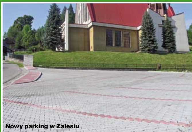
Nowy parking w Zalesiu