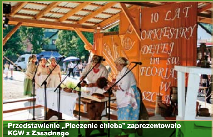
Prezentowanie „Pieczenie chleba” zaprezentowało KGW z Zasadnego