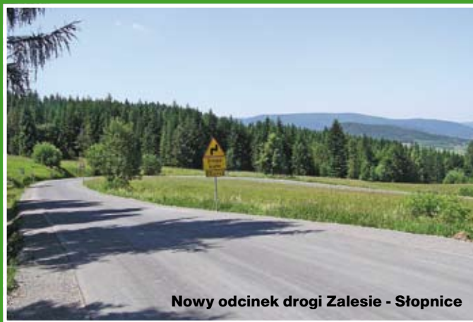
Nowy odcinek drogi Zalesie - Stopinice