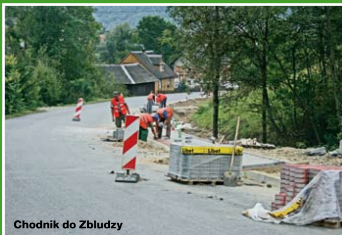
Chodnik do Zbludzy