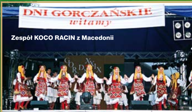
Zespół KOCO RACIN z Macedonii