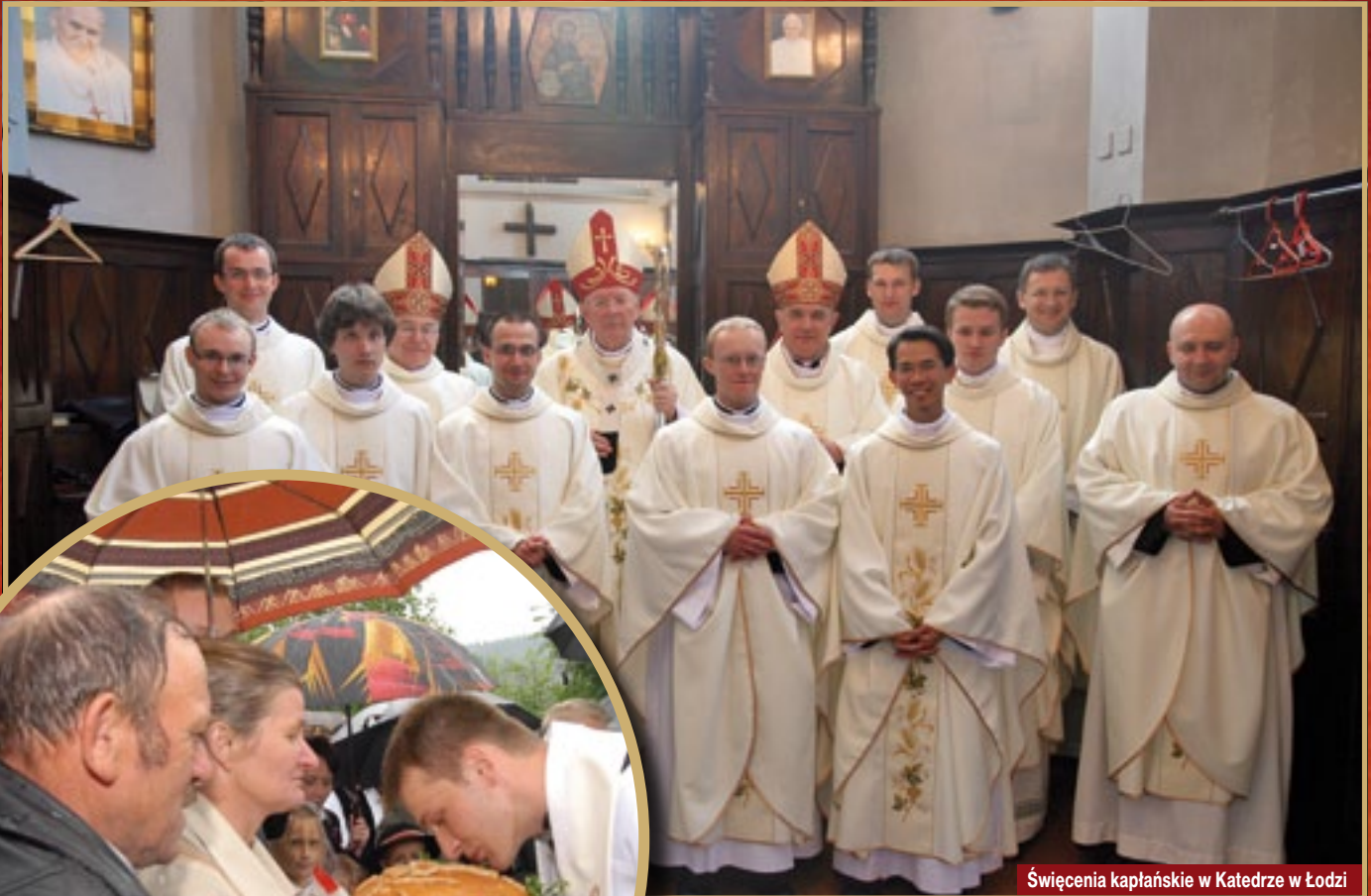
Święcenia kapłańskie w Katedrze w Łodzi