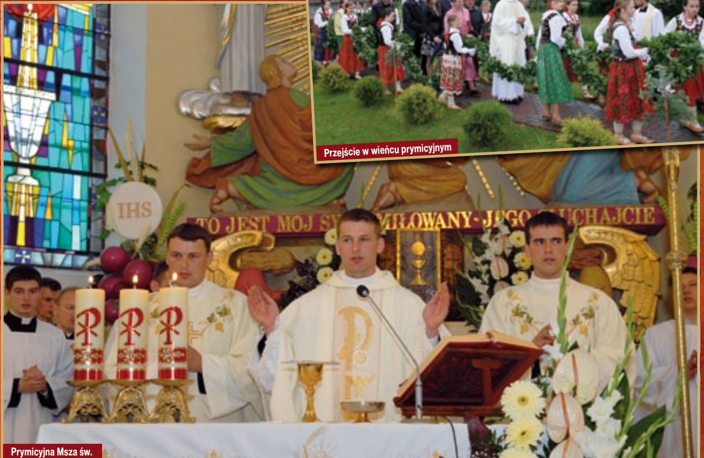
Prymicyjna Msza św.