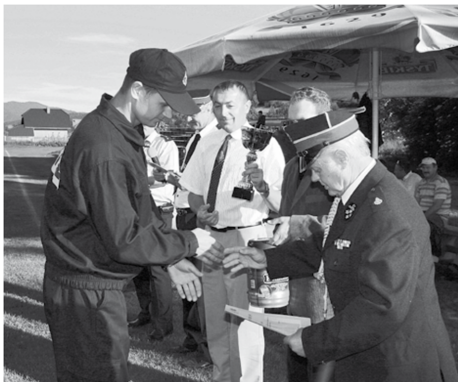
Gratulacje i nagrody za zwycięstwo odbierają druhowie z OSP Kamienica .

Tradycyjne konkurencje sportowe dostarczyły widzom wiele emocji. Dużą