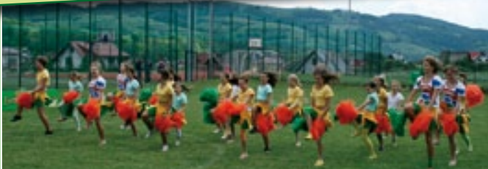
Występ zespołu tanecznego „Lambada”, działającego przy SP nr 1 w Kamienicy