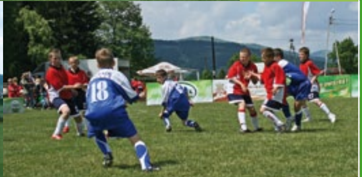
MUKS „Halny” z Kamienicy w meczu z drużyną Hutnika Kraków