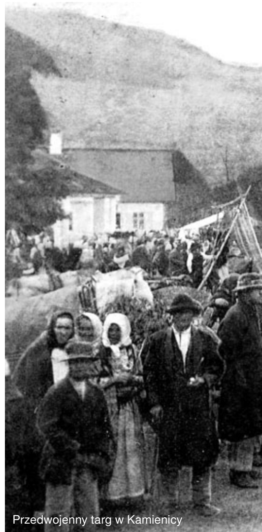
Przedwojenny targ w Kamienicy

Przed 01 września 1939 roku w powiecie limanowskim żyło około 2700 Żydów. Nie wiadomo dokładnie, ile osób pocho-