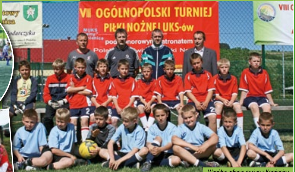
Wspólne zdjęcie drużyn z Kamienicy