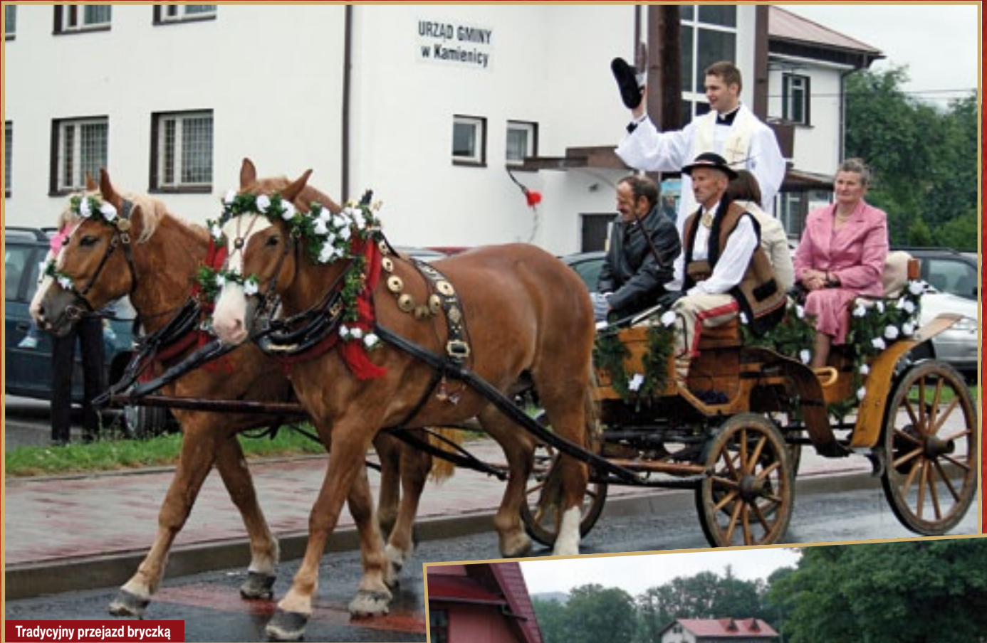
Tradycyjny przejazd bryczką