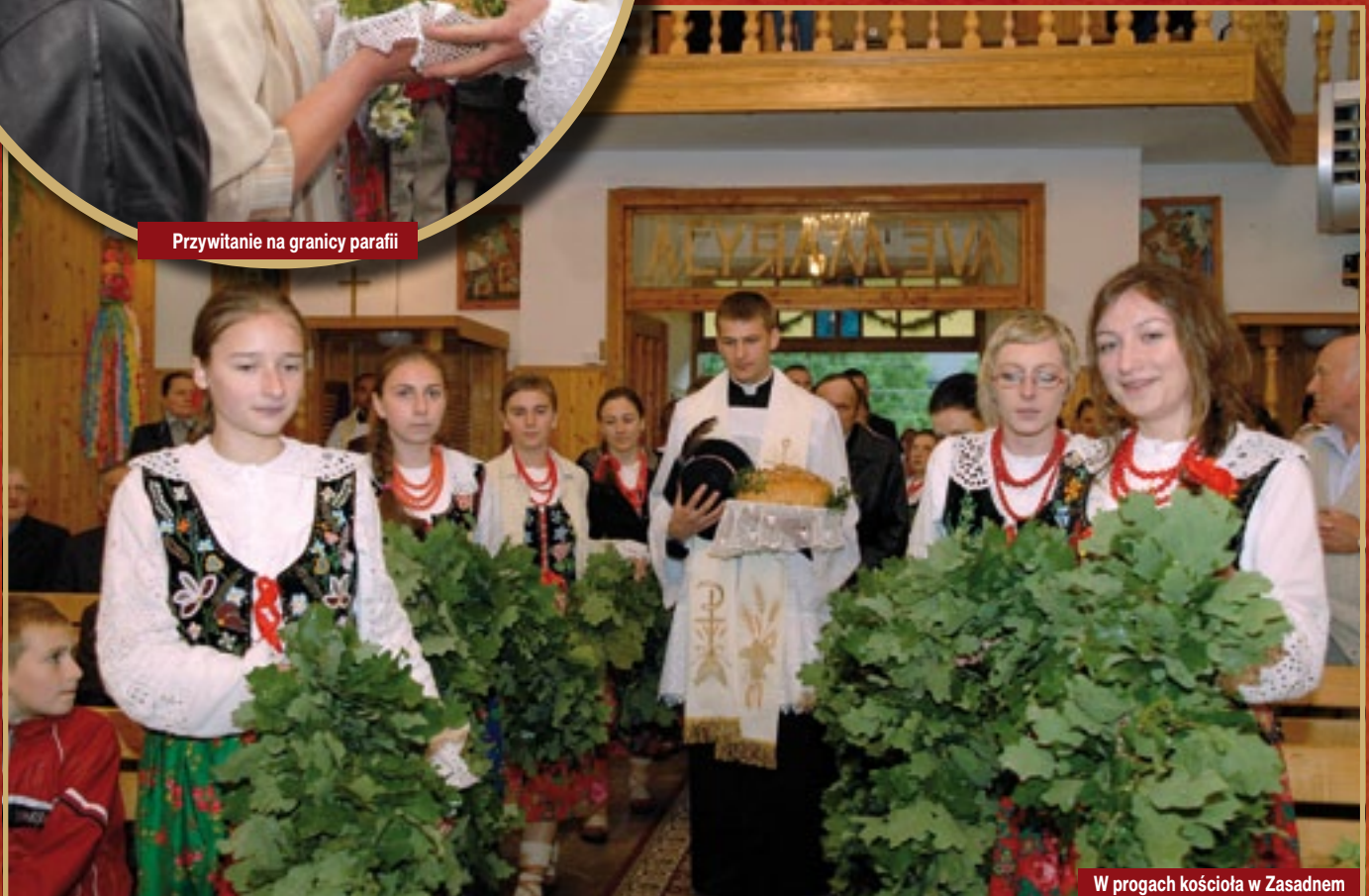
W progach kościoła w Zasadnem