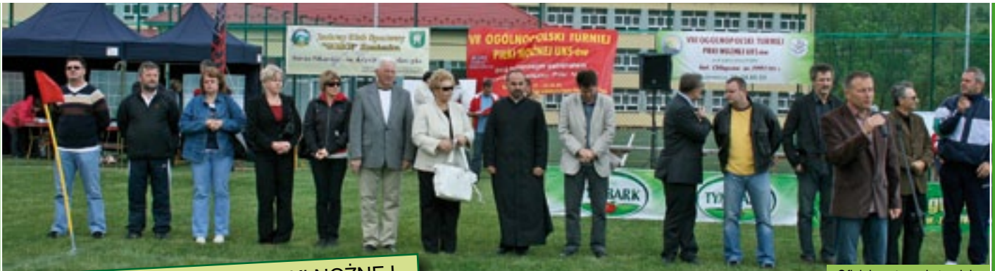
Oficjalne otwarcie turnieju