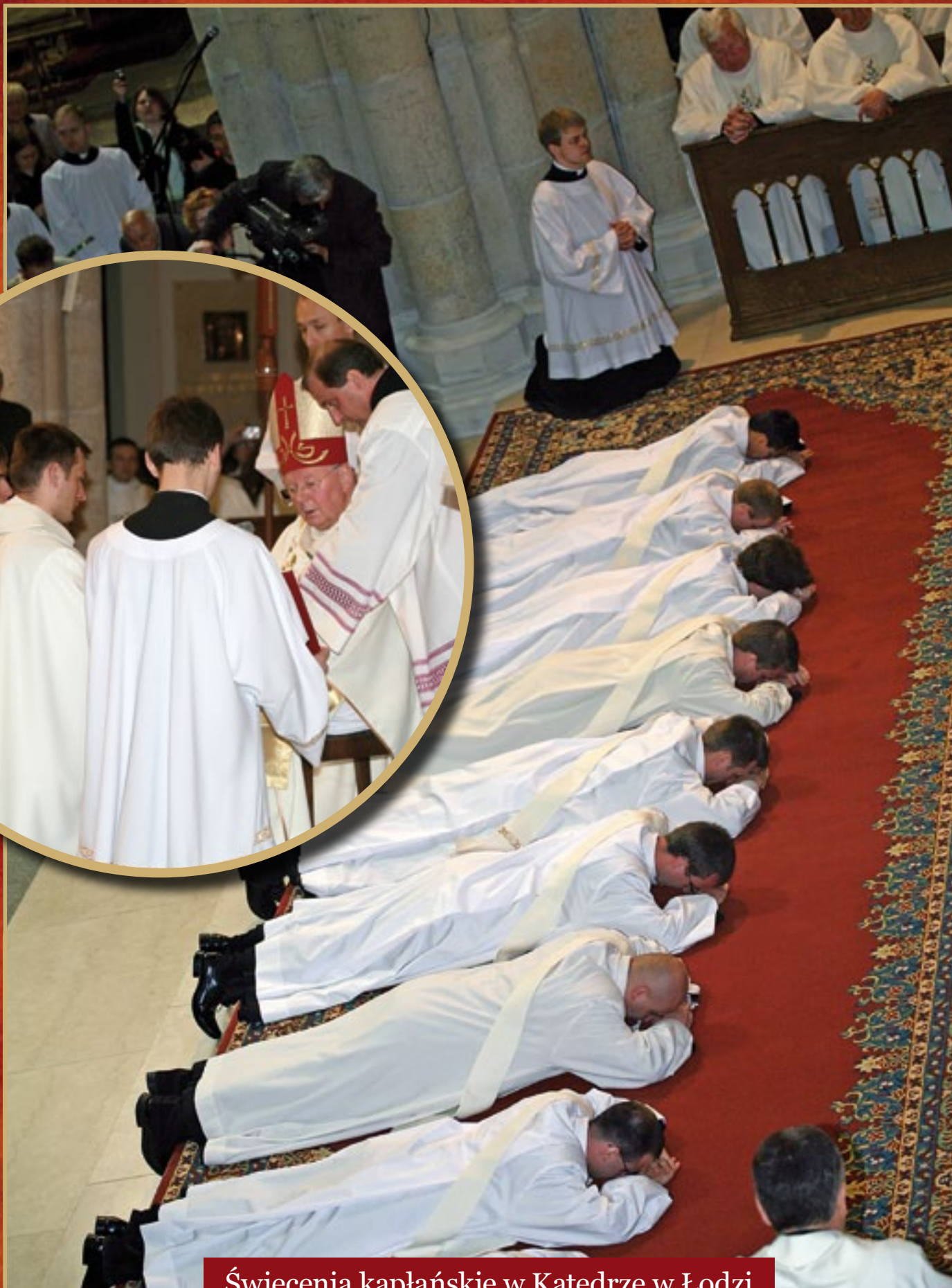
Święcenia kapłańskie w Katedrze w Łodzi