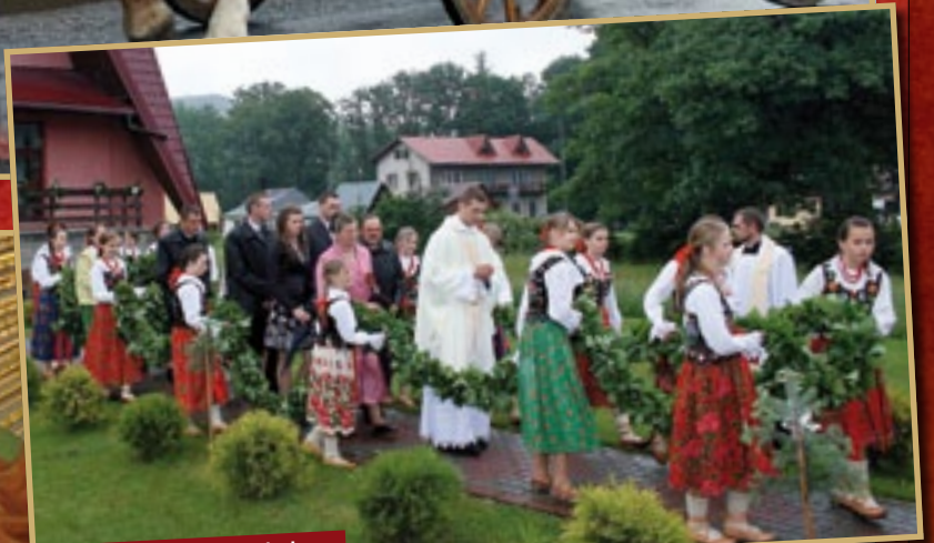
Przejście w wieńcu prymicyjnym