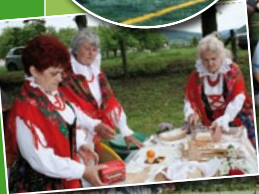
Prysmaki regionalne serwowały panie z Koła Gospodyń Wiejskich z Kamienicy