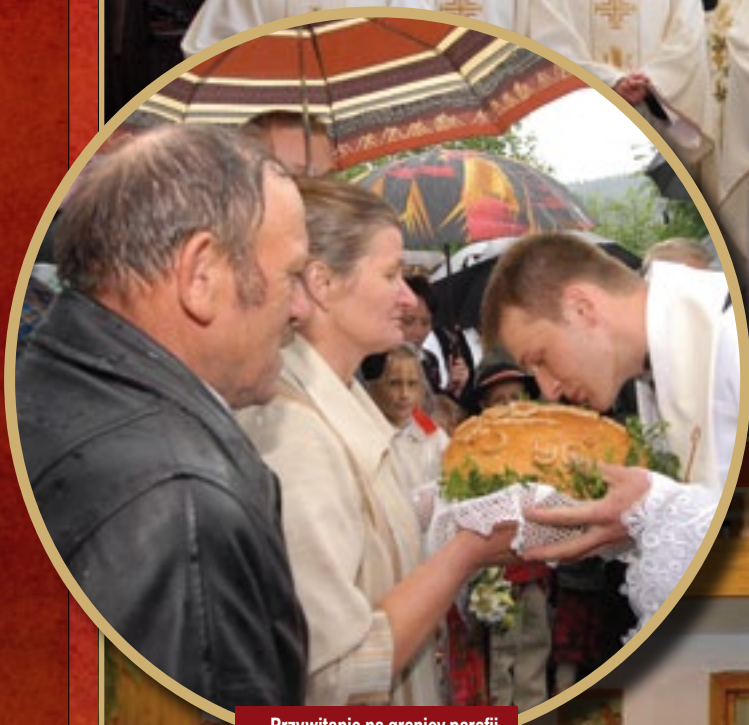
Przywitanie na granicy parafii