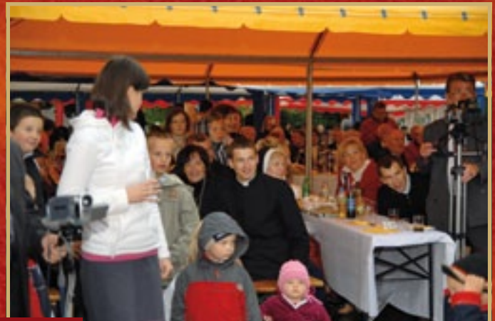
Z życzeniami u Prymicjanta